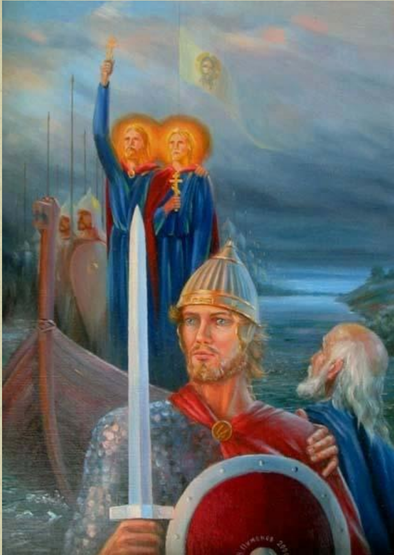
В. Пименов. Перед Невской битвой

Но этот надменный вызов не смутил юного героя. Принеся молитву всевышнему, Александр принял благословение от владыки Спиридона, и с краткой речью обратился к дружине: «Братья! Не в силах Бог, а в правде! Не убоимся множества ратных, яко с нами Бог!»