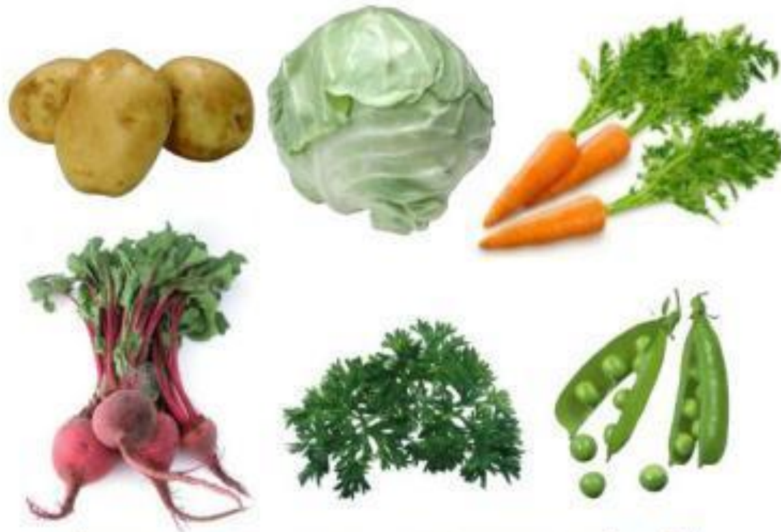
Картошку, капусту, морковку, горох, петрушку и свёклу. Ох!..