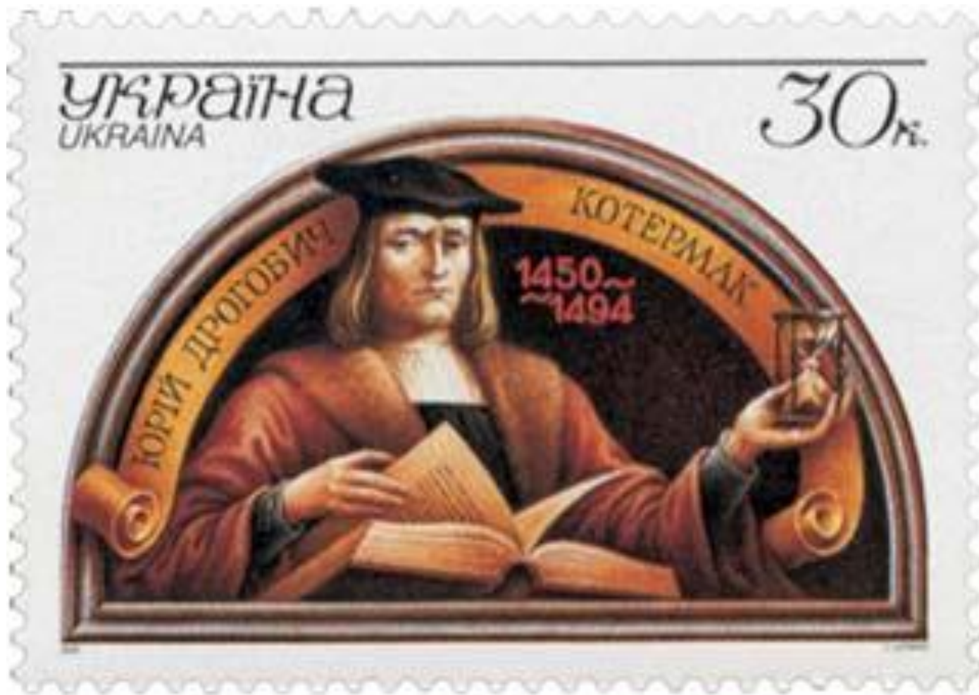
Юрій Котермак на українській поштовій марці