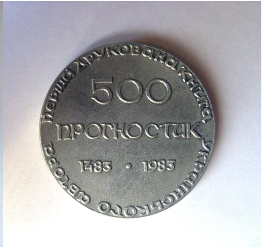
Зворотний бік пам'ятної медалі , випущеної до 500-ліття "Прогностичної оцінки поточного 1483 року Ю. Дрогобича.