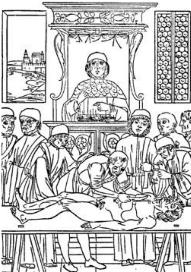
Лекції з медицини. Гравюра XV ст.

У XV ст український вчений Дрогобич був широко відомий у Європі як автор одного з перших у світі астрономічних календарів, як доктор медицини і філософії, ректор Болонського університету та професор Ягеллонського університету в Кракові.