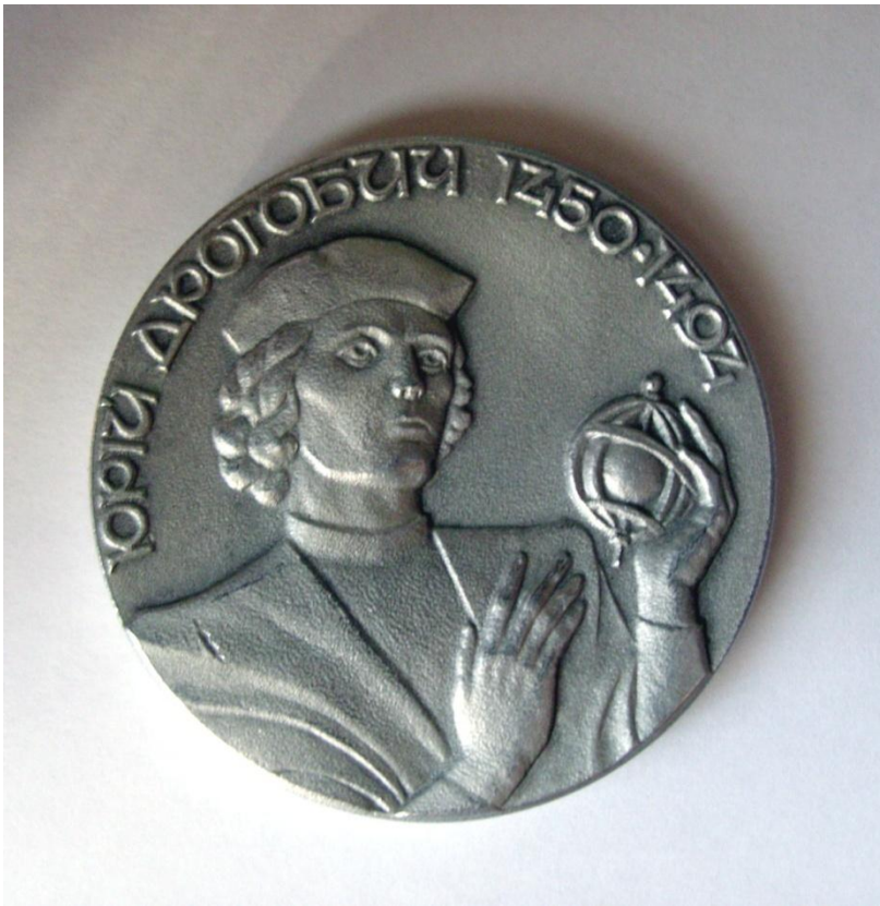
Лицевий бік пам'ятної медалі , випущеної до 500-ліття "Прогностичної оцінки поточного 1483 року Ю. Дрогобича