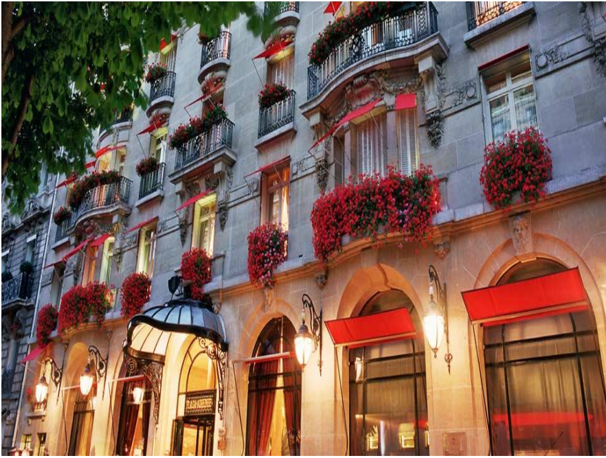
Plaza Athénée hotel