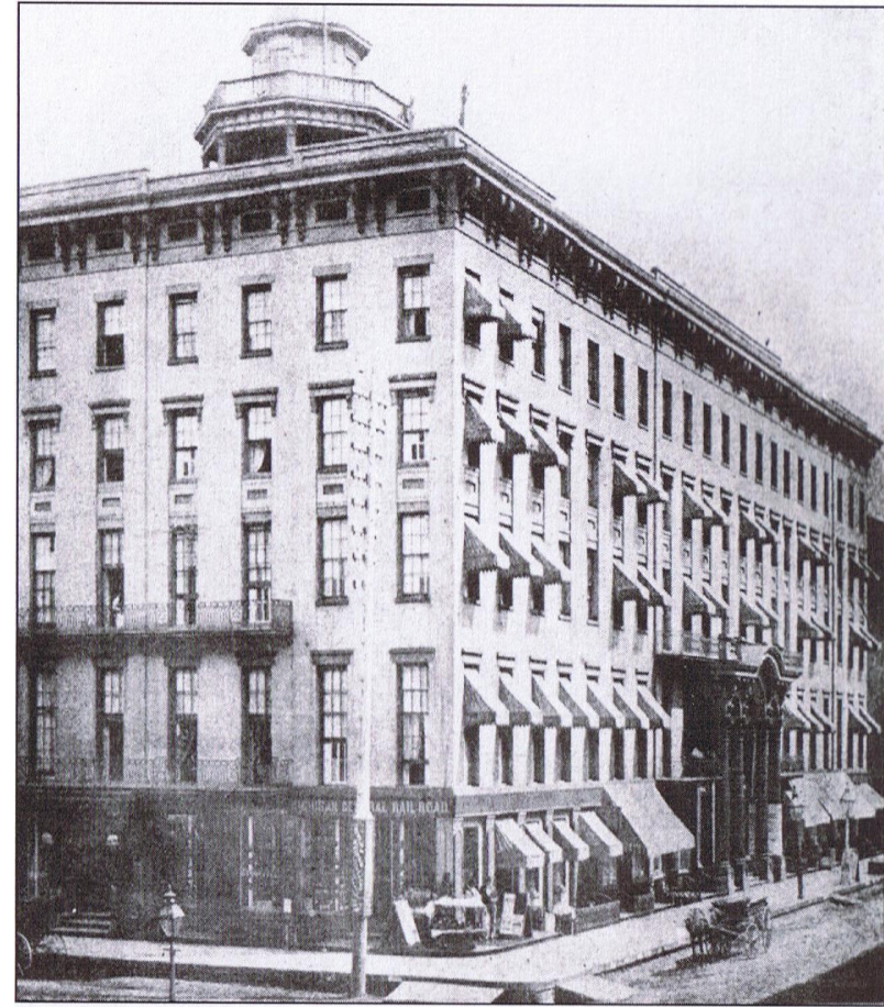
Tremont House, 1829