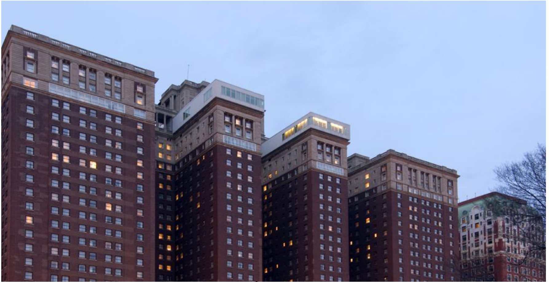
Hilton & Towers

Для американской гостиничной индустрии 20-е гг. XX в. стали периодом массового строительства гостиниц, в том числе и тех, которые известны и функционируют до сих пор