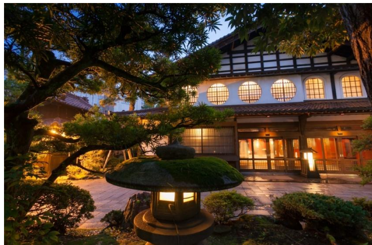
Houshi Ryokan Japan's hotel