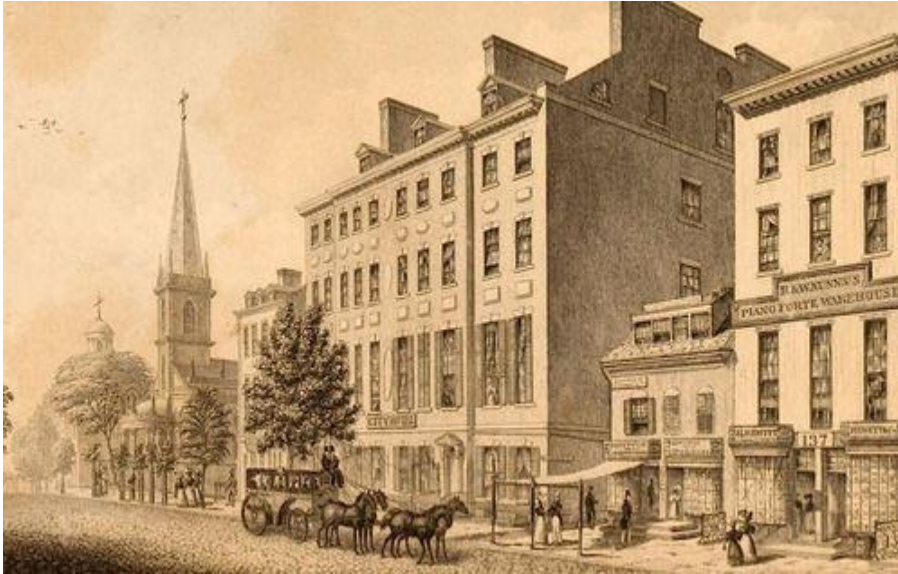
City hotel, 1794