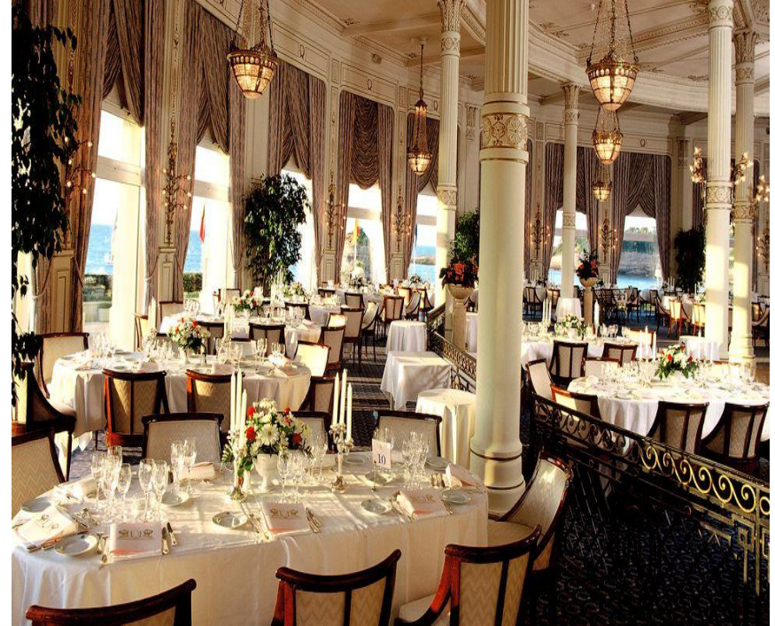
Hotel du Palais 5*