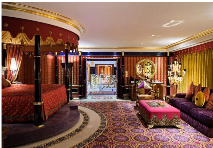
Dubai Burj al-arab room