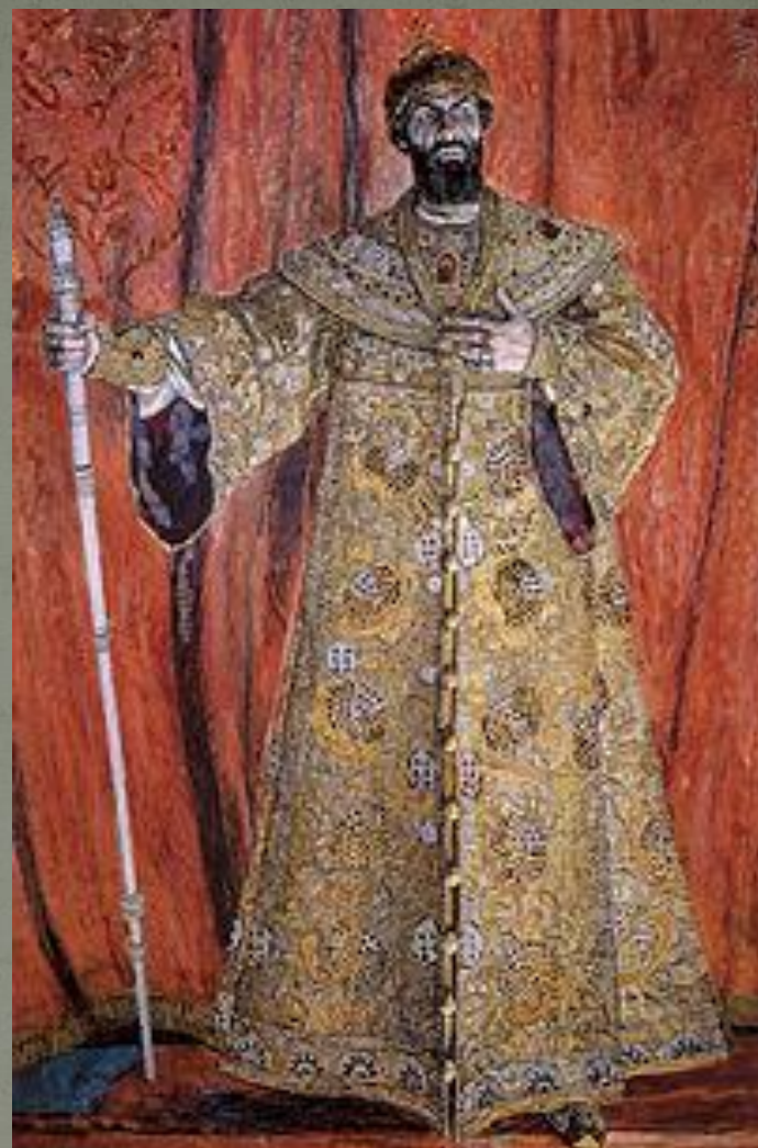
Ф. Шаляпин в роли Бориса Годунова