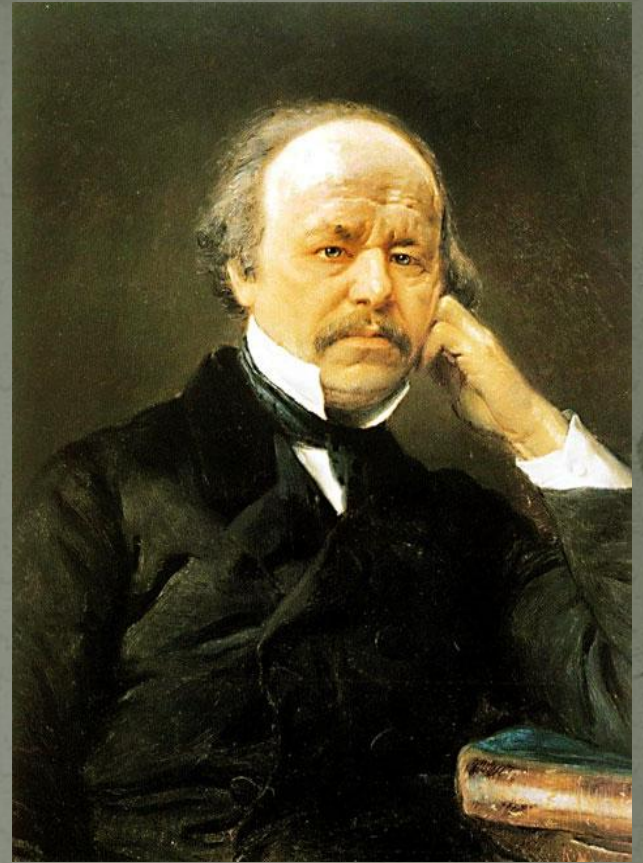
Александр Сергеевич Даргомыжский

По окончании школы в 1856 году Мусоргский сблизился с А.С. Даргомыжским, а год спустя — с М.А. Балакиревым, который и распознал его композиторский талант. Под влиянием Балакирева в 1858 году он вышел в отставку, чтобы посвятить себя музыке. Но в то время композиторское творчество не давало никаких средств для существования, и юноша был вынужден устроиться на службу чиновником. В эти годы Мусоргский еще ближе сходитя со Стасовым, Кюи. Так образовалось ядро «Могучей кучки», к которому впоследствии примкнули Бородин и Римский-Корсаков.