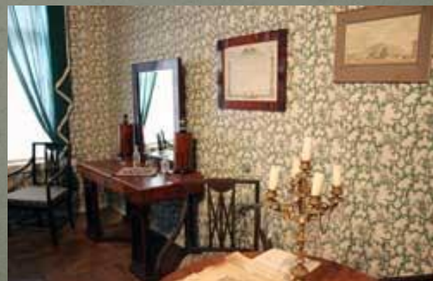
Мемориальный музей-усадьба композитора М.Мусоргского