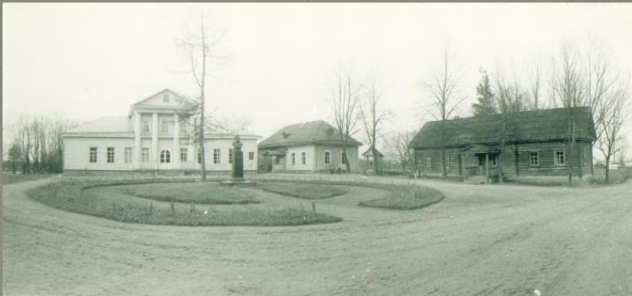
Усадьба композитора М.П. Мусоргского