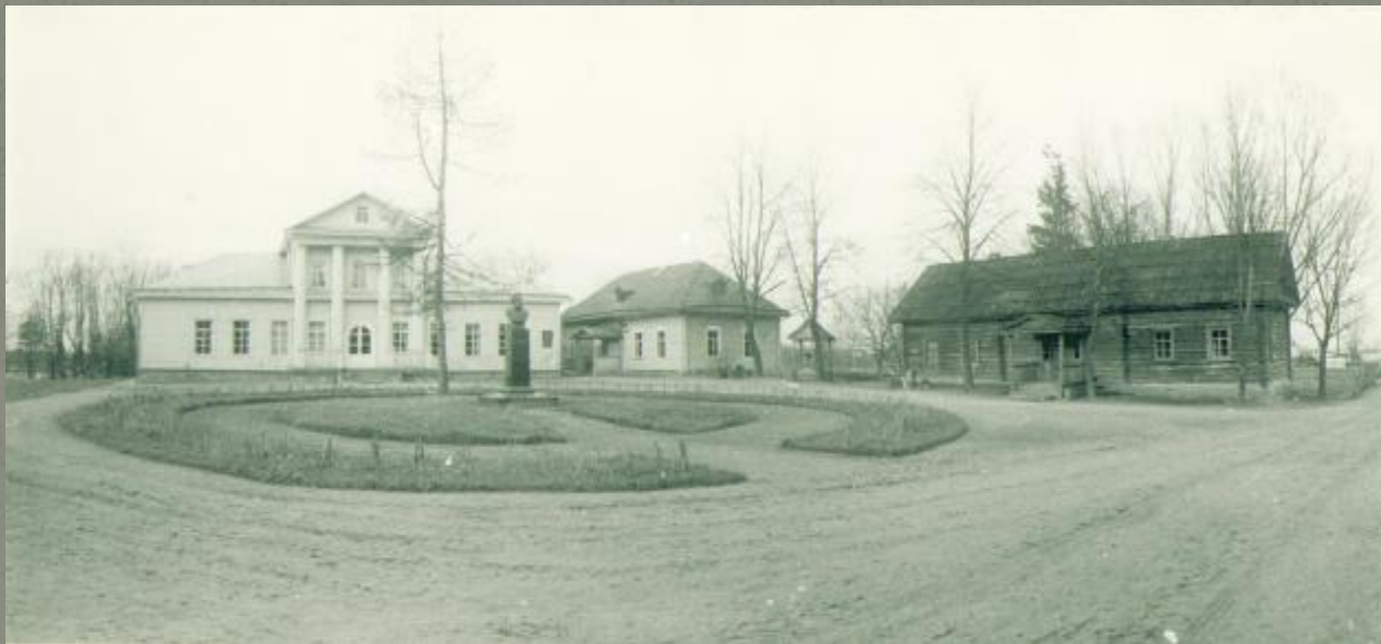
Усадьба композитора М.П. Мусоргского