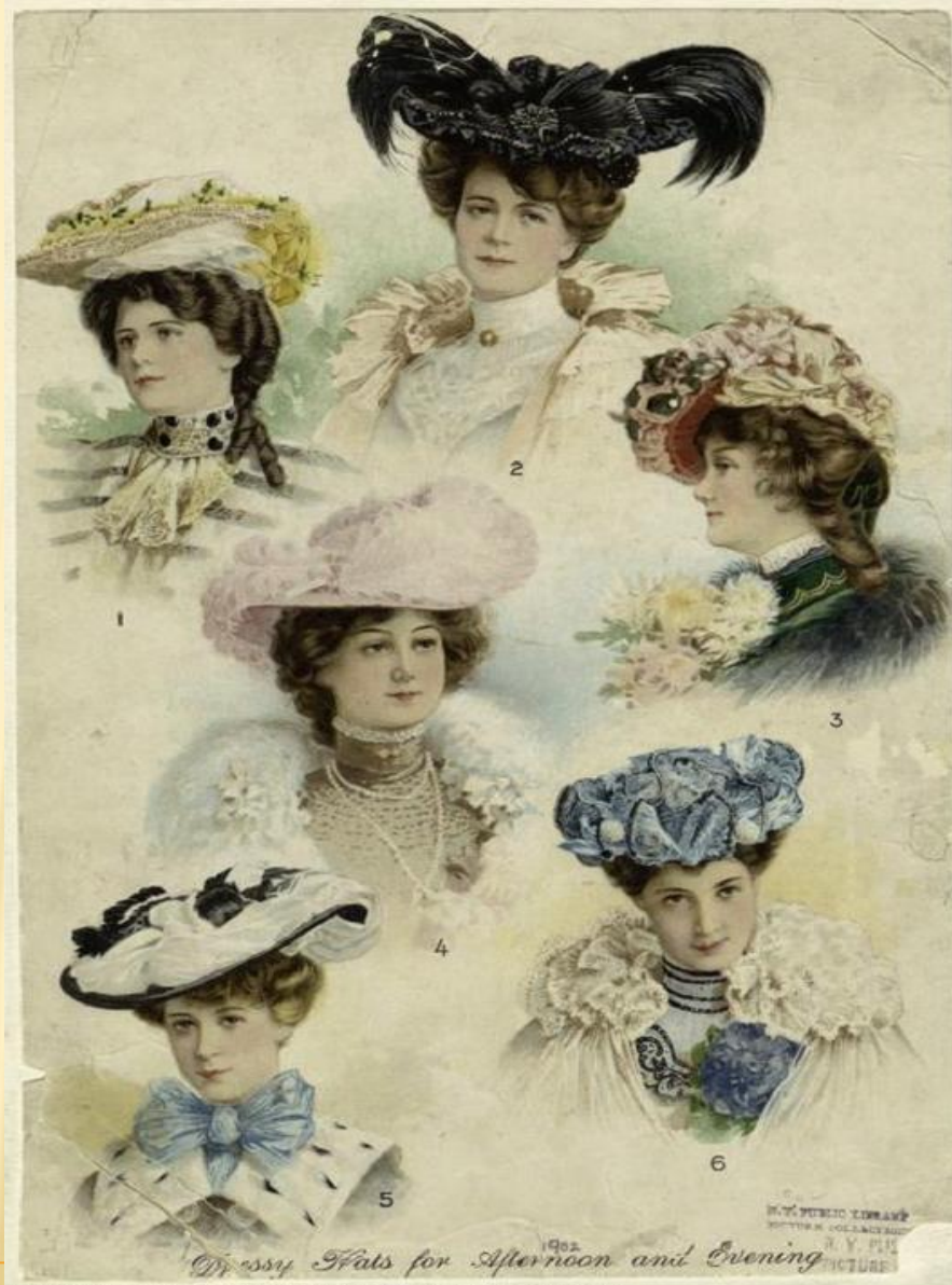
Dressy hats for afternoon and evening. Written on border: "1902"

Ребята, сегодня мы с вами познакомимся с интересной деталью одежды, а именно шляпой. Давайте сначала выясним, что же это такое «Шляпа»?