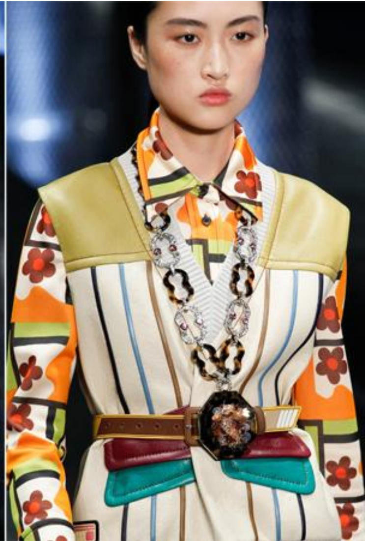
Цепи и массивные кулоны стиле арт-деко дополняли каждый второй образ от Prada