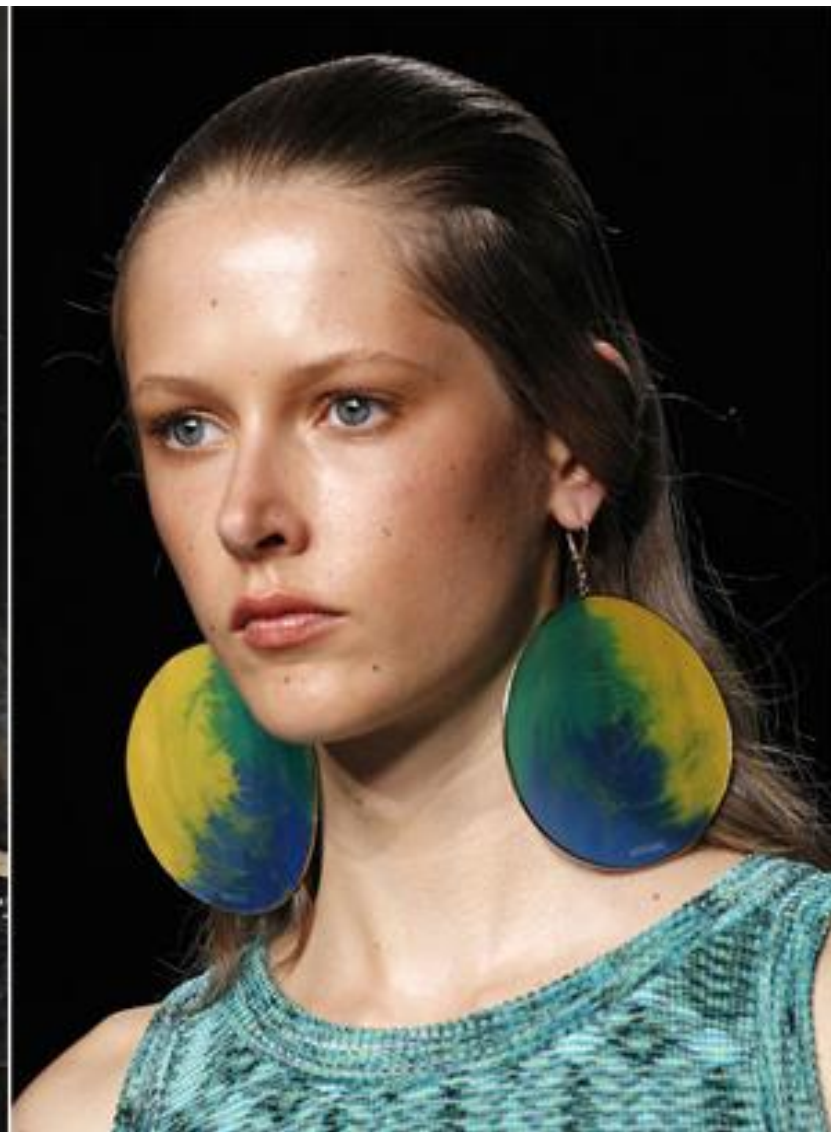
Модные серьги от Yve Saint Laurent и Missoni весна-лето 2017