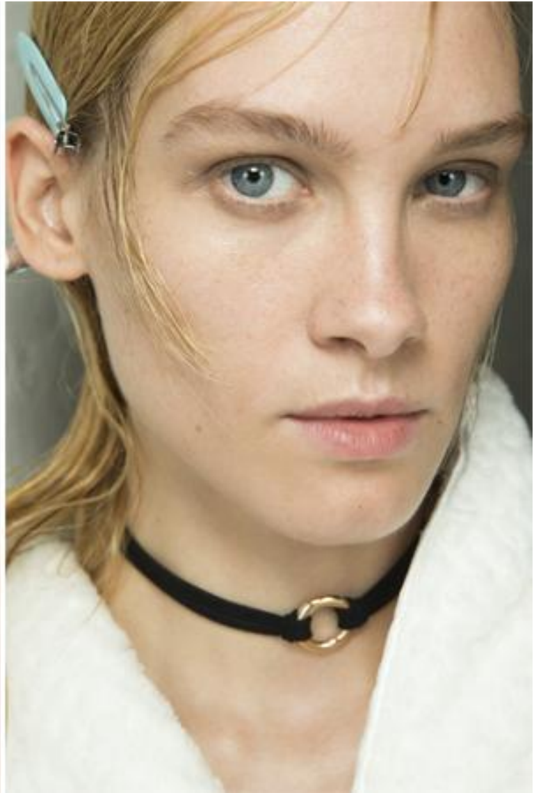
Модные чокеры от Celine Christopher Kane весна-лето 2017