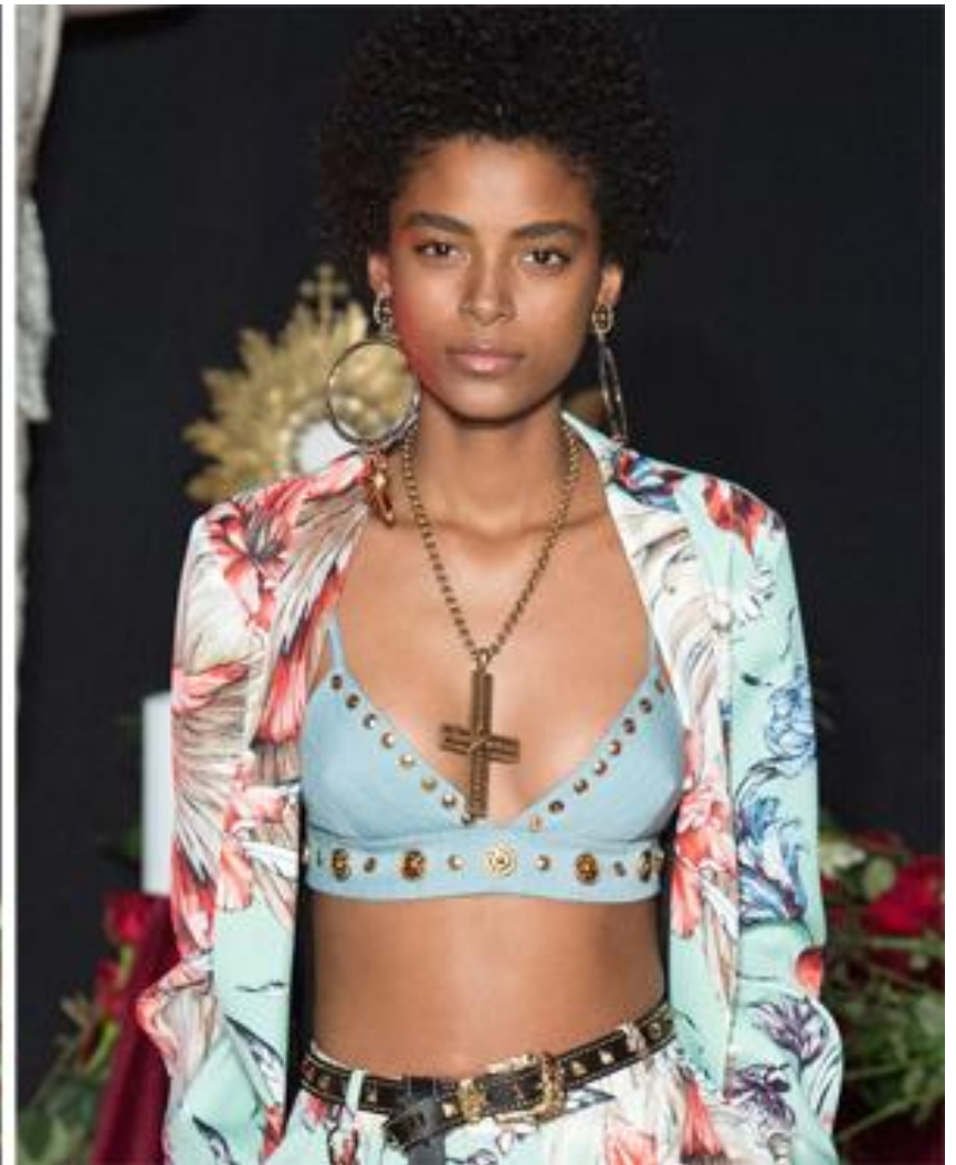
Коллекция Fausto Puglisi