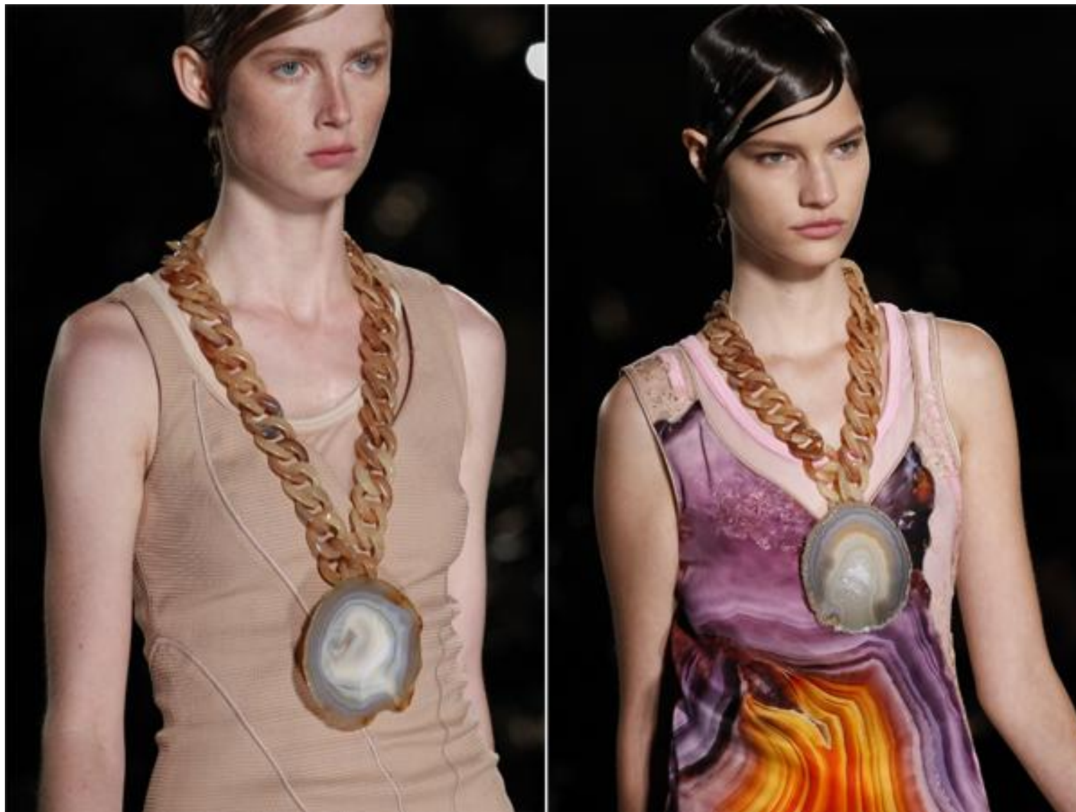
Минеральные камни в моде весной и летом 2017