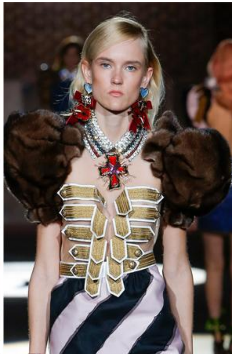
Модные кулоны в виде крестов в коллекции Dsquared2