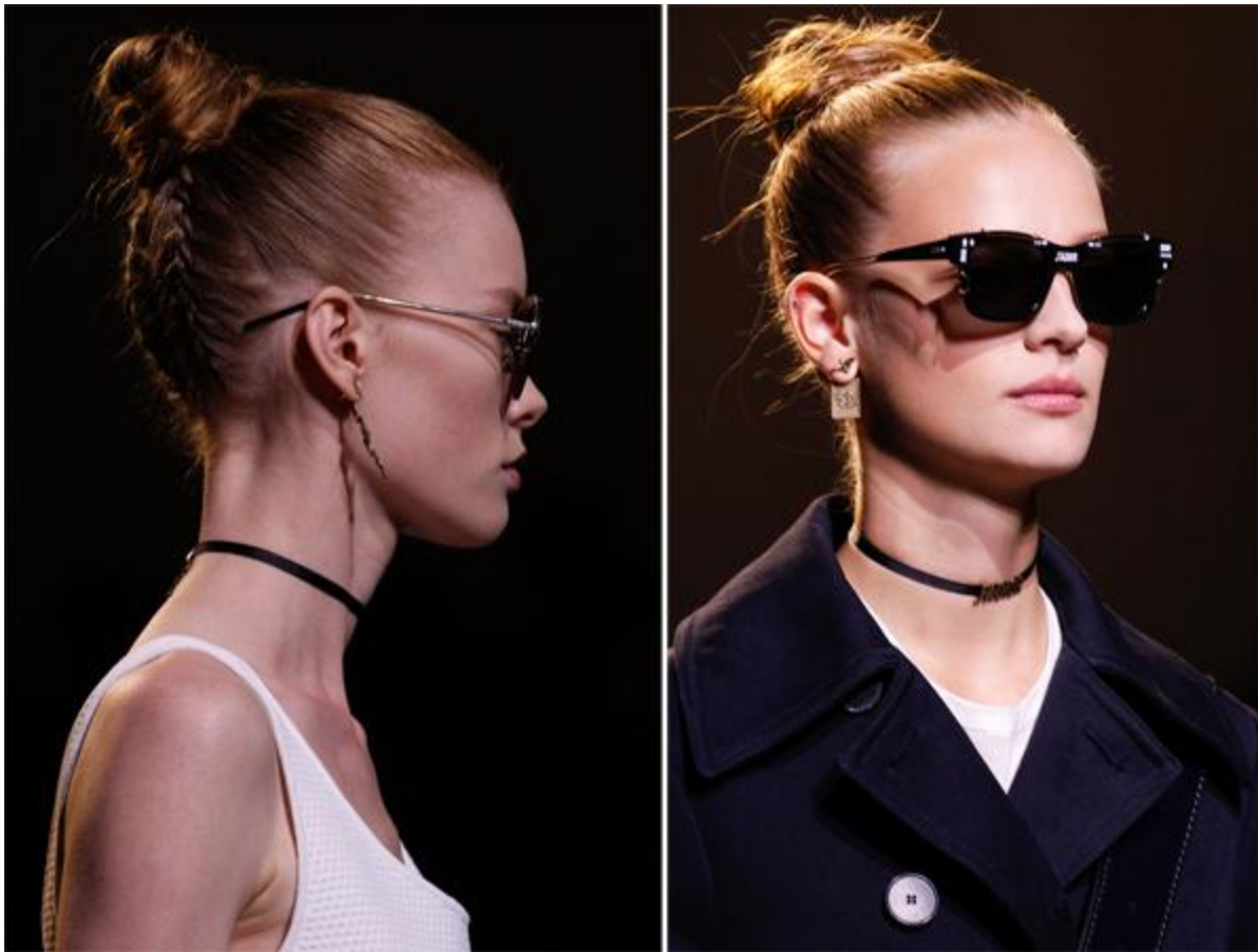
Кожаные чокеры Christian Dior весна-лето 2017

Ожерелья-чокеры уже несколько сезонов не покидают подиумов. Модный чокер сезона весна-лето 2017 должен быть лаконичным, выполненным из кожи, шелка или бархата. Допускаются декоративные элементы, например, золотое кольцо, пластина или украшение в виде слова ( j'adore, i love u и т. д.).