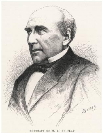
Фредерик Пьер Ле Пле

Концепт «от семьи – института к супружескому партнерству»