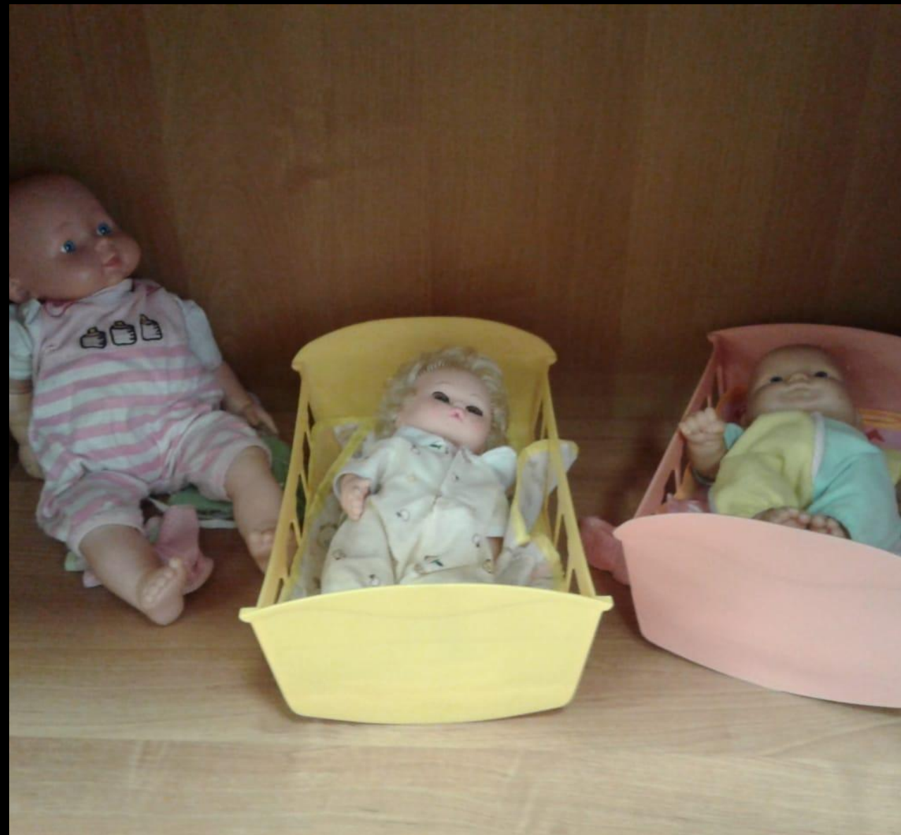
Атрибуты для сюжетно-ролевой игры «Семья»