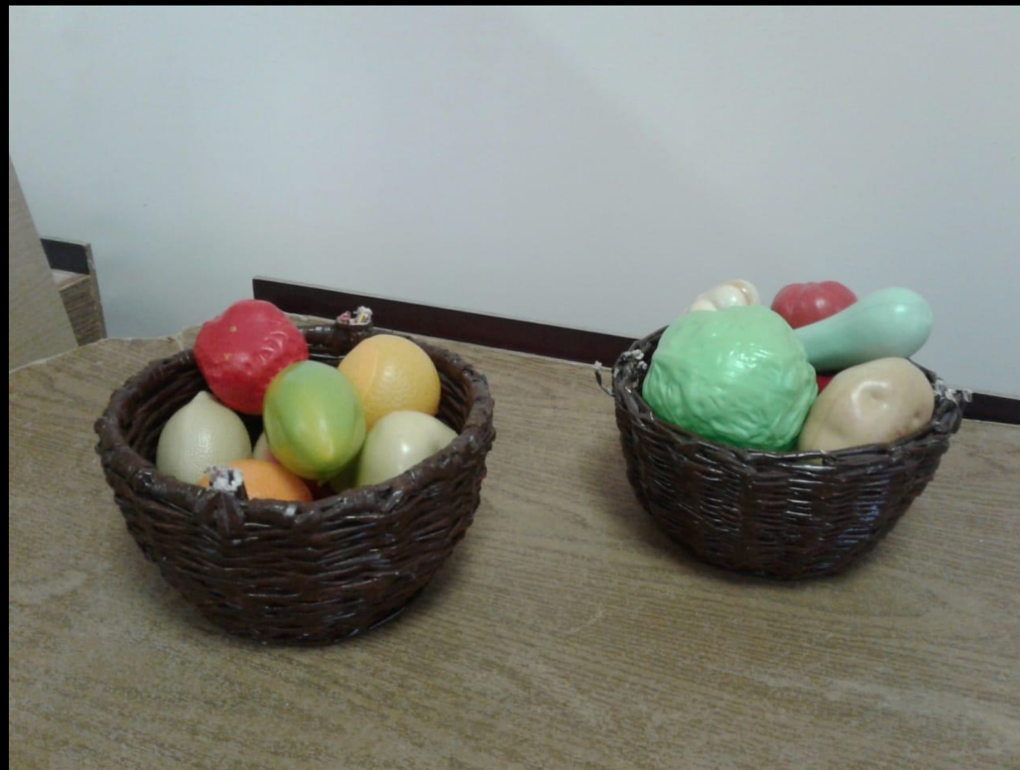
Муляжи овощей и фруктов для сюжетно-ролевой игры «Магазин»