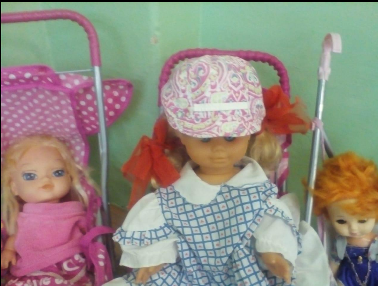
Куклы для девочек