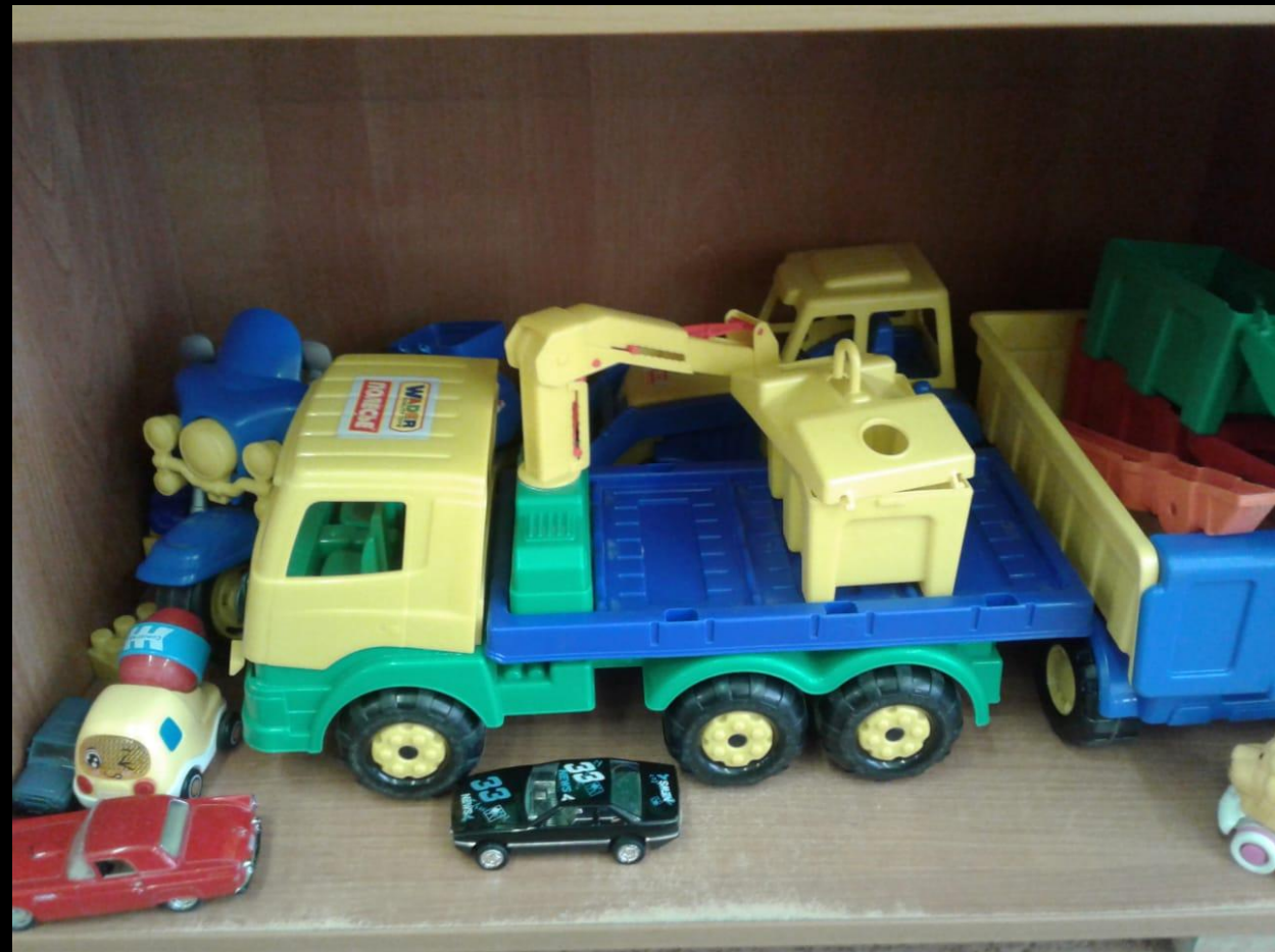
Сюжетно –ролевая игра «Гараж»