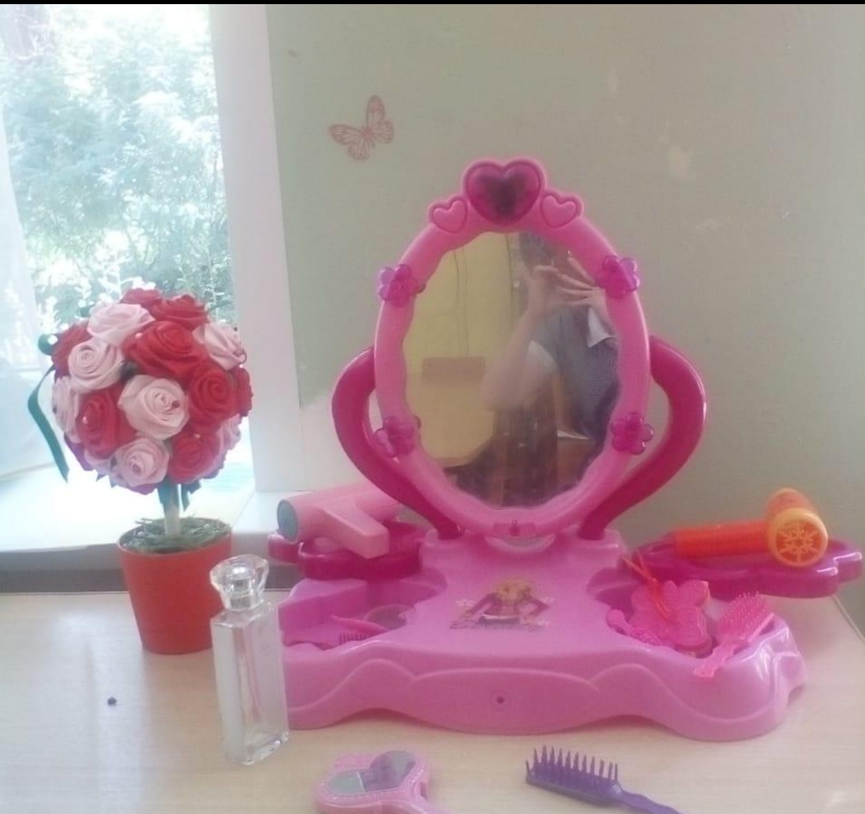
Сюжетно-ролевая игра «Салон красоты»