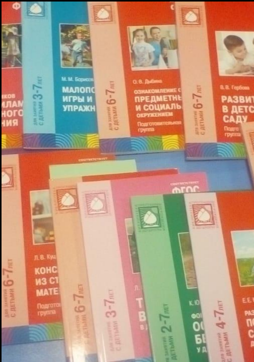
1.6. Рабочий сектор (методическая литература педагога)