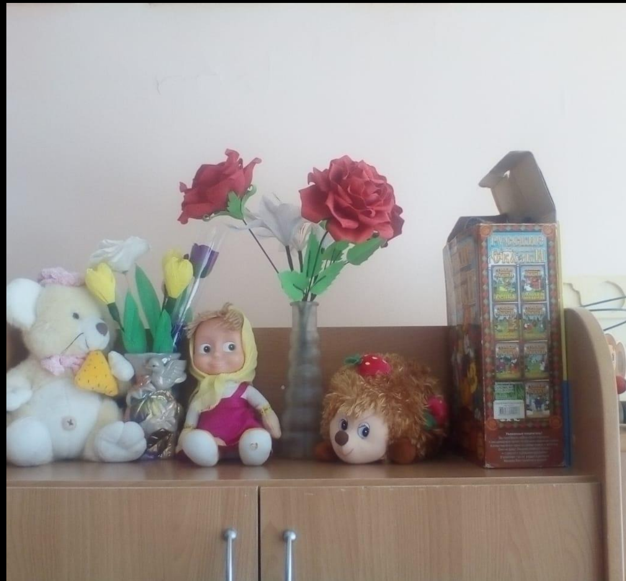
Мягконабивные игрушки используются для сюрпризных моментов при проведении оод.