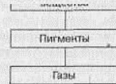
Рис. 5.1. Компоненты молока