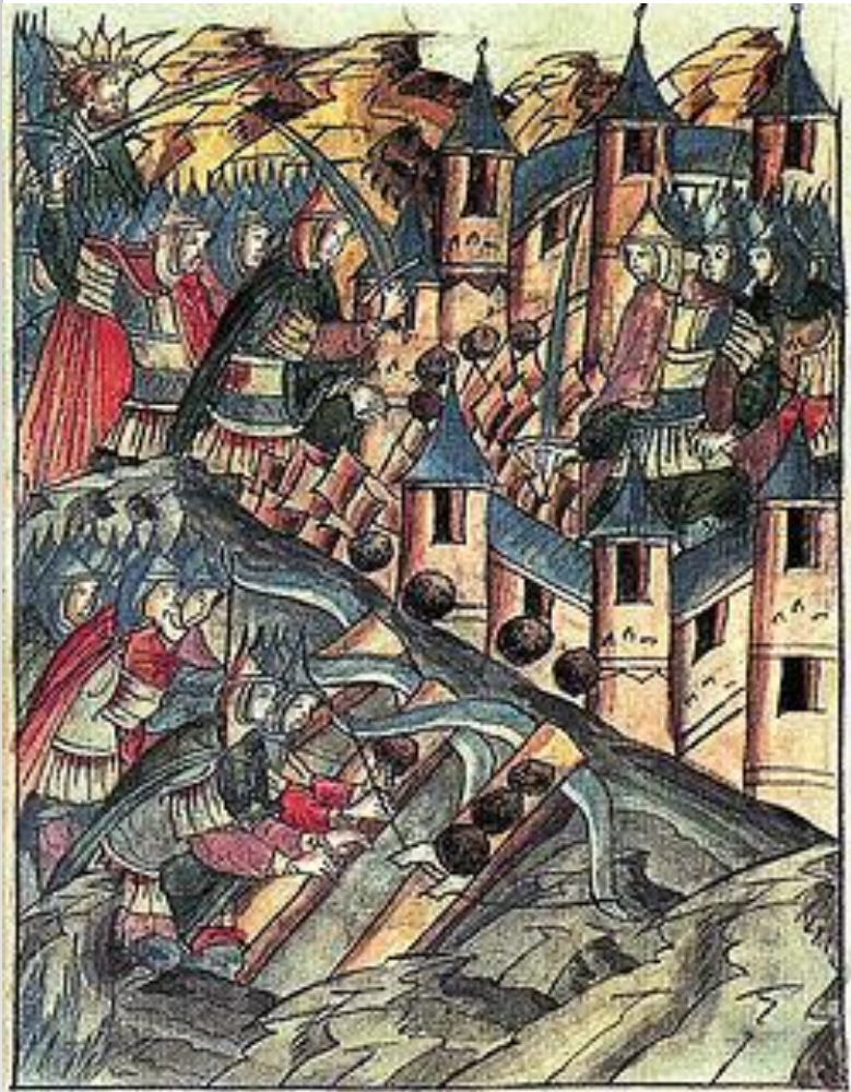
Оборона Козельска. Миниатюра из русской летописи

После взятия 5 марта 1238 года Торжка основные силы монголов, не дойдя 100 вёрст до Новгорода, от Игнач Креста повернули назад в степи. Причинами этого стали: весенняя распутица, огромные потери и угроза нехватки корма. Разоряя города на обратном пути, они встретили неожиданно упорное сопротивление города Козельска, жители которого семь недель отражали монгольские атаки.