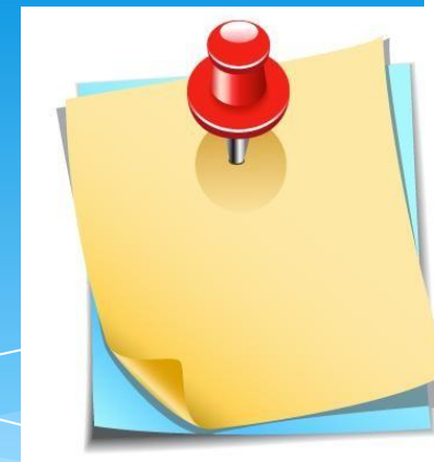
Стенд «Наши успехи»