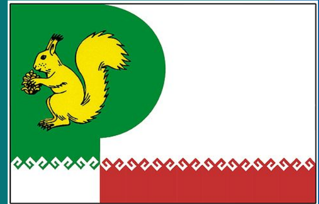
Флаг Моркинского района

Утвержден решением Собрания депутатов МО Моркинский муниципальный район Республики Марий Эл (№ 52) от 21 июня 2006.