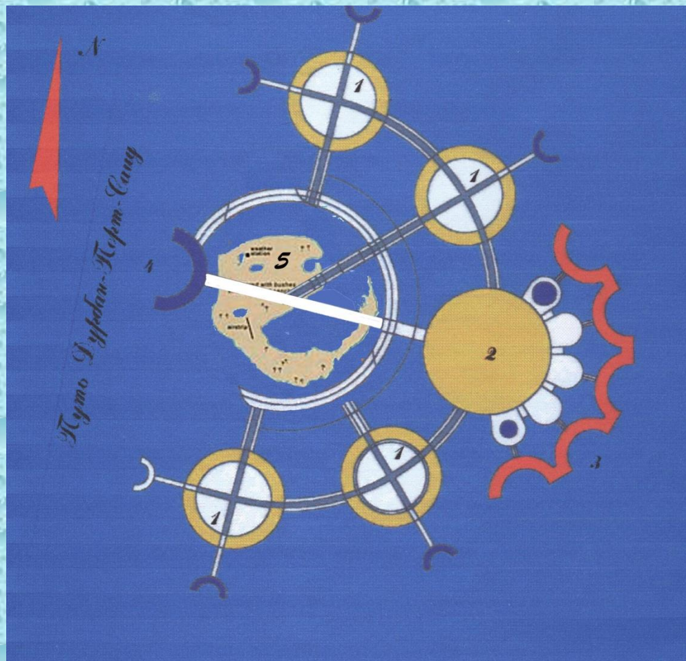
Схема расположения нового города Сальто-Марино-Анхель и острова Европа