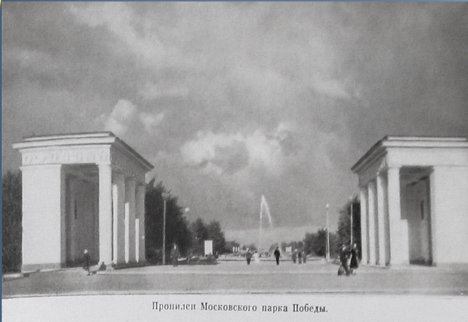
Пронилел Московского парка Победы.