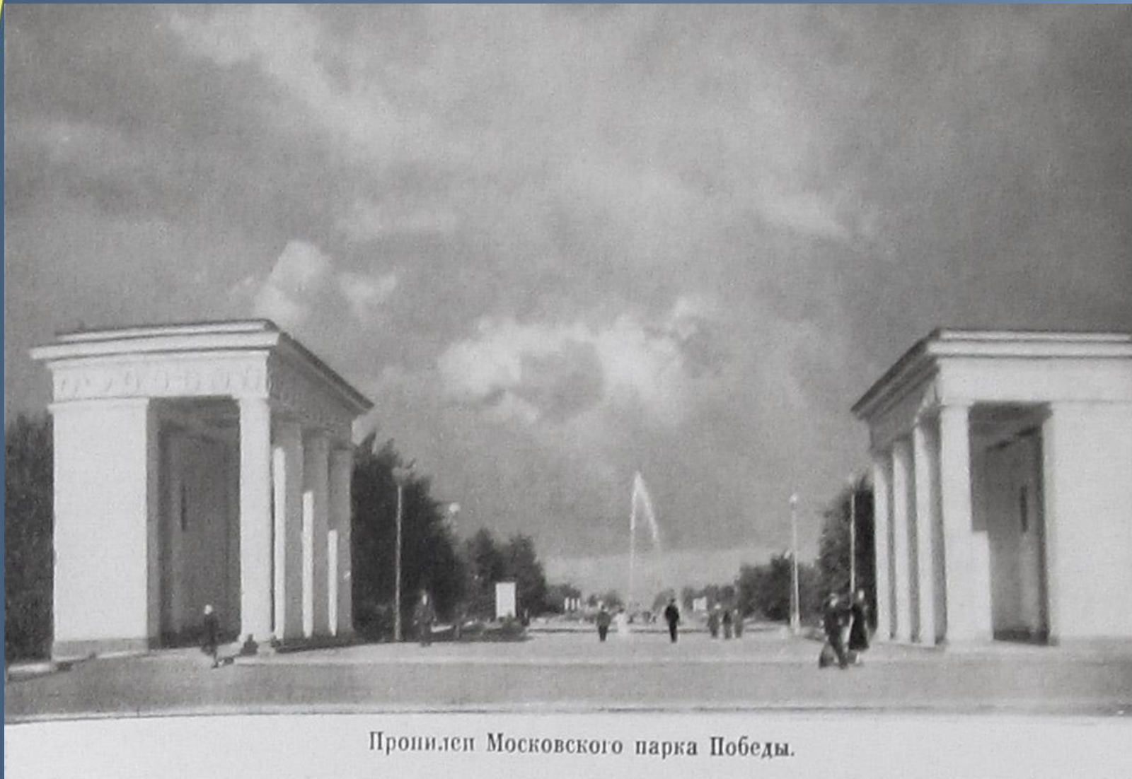
Пронилел Московского парка Победы.