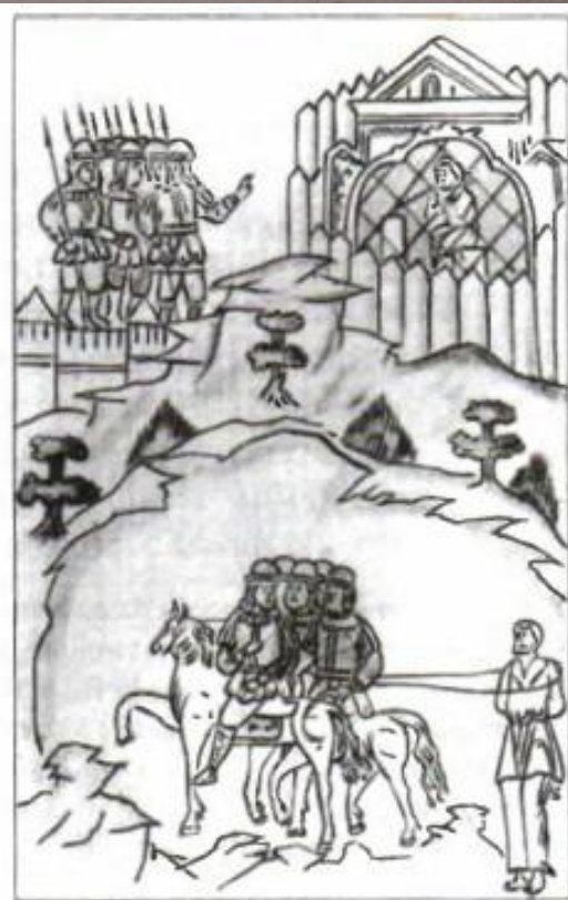
Поимка и привод к хозяину беглого крестьянина. Рисунок XVIII в.