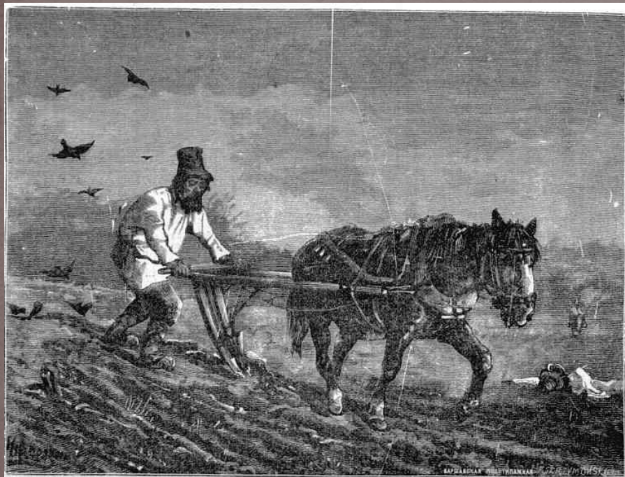
Великорусская соха. — Рисунок Н. Каравина.