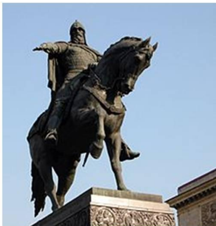
Памятник Юрию Долгорукому - основателю Москвы

Появление названия города, как и названий многих городов мира, связано с именем реки Москвы, которая носила это имя задолго до появления поселения. Река Москва представляла собой связующее звено между важными торговыми путями. Основание Москвы датируется 1147 годом и приписывается Великому князю Киевскому Юрию Долгорукому ..