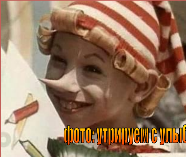
фото: утрируем с улыбкой!