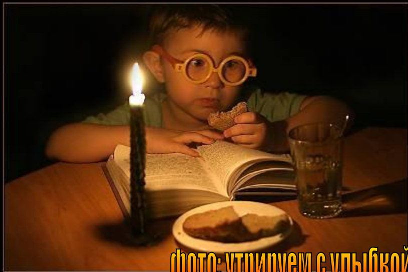
фото: утрируем с улыбкой!