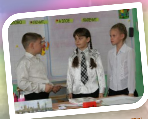
КВН «Доброе слово лечит...»