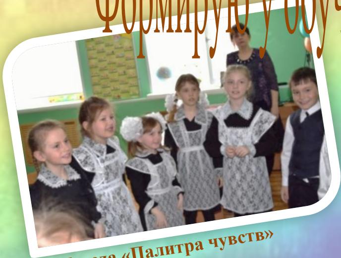
Беседа «Палитра чувств»