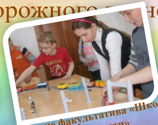
Занятие факультатива «Школа безопасности»