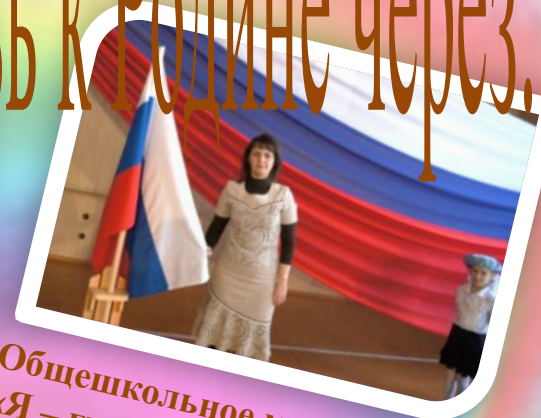
Общешкольное мероприятие «Я – гражданин России»