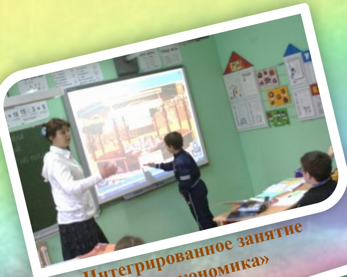
Интегрированное занятие «Весёлая экономика»

Формирую учебную самостоятельность учащихся, развиваю способность самостоятельно ориентироваться в решении нестандартных задач через: