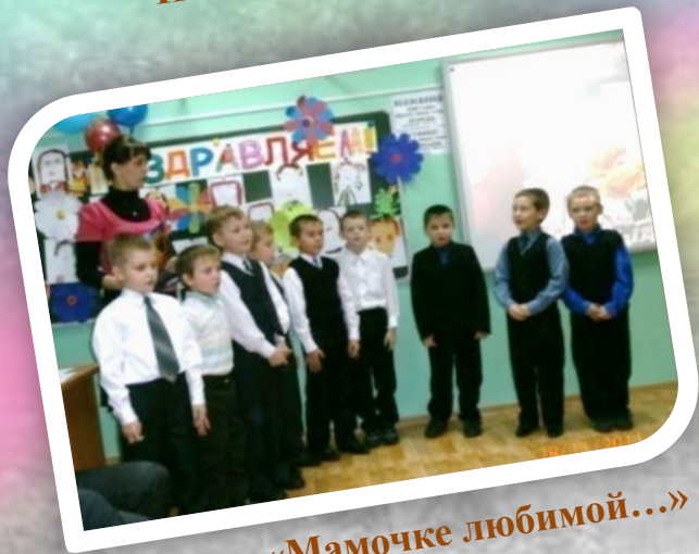
Концерт «Мамочке любимой...»