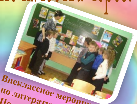
Внеклассное мероприятие по литературному чтению «По дорогам любимых книг»