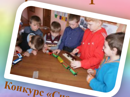
Конкурс «Счастливого пути!»