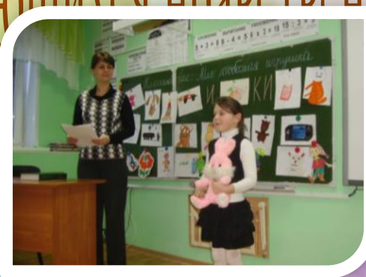
Классный час «Наши верные друзья-игрушки»