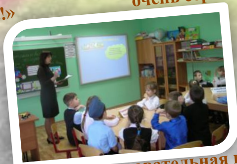
Конкурсно-познавательная игра «Путешествие по железной дороге»