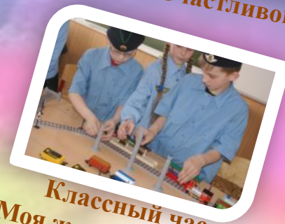
Классный час «Моя железная дорога»