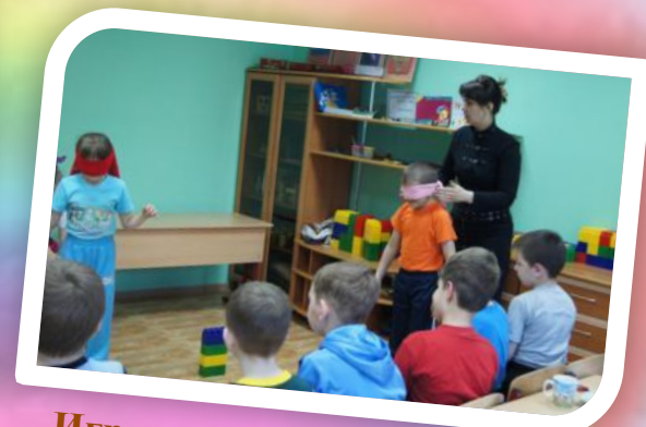
Игра-соревнование «Один за всех и все за одного!»