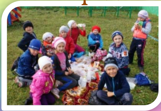
Экскурсия «Безопасный отдых на природе»