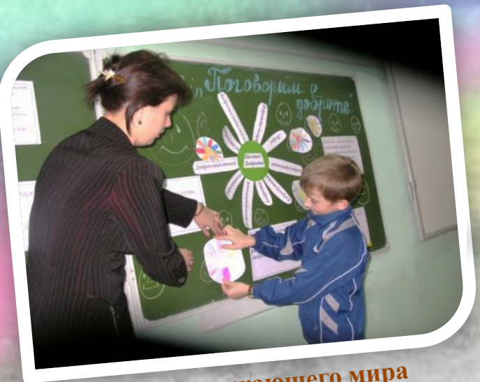
Урок окружающего мира «Поговорим о доброте»