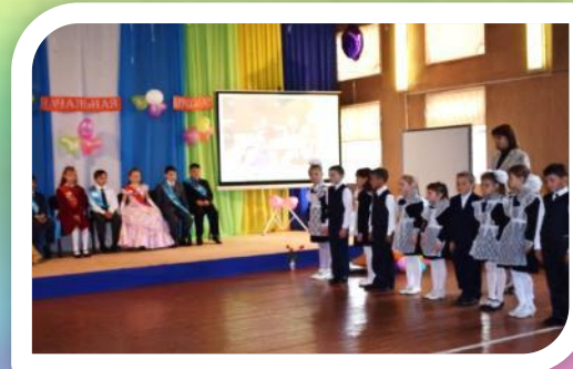
Конкурс Маленький принц