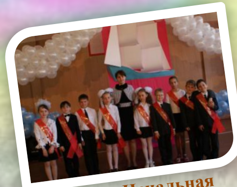
Праздник «Начальная школа, прощай!»