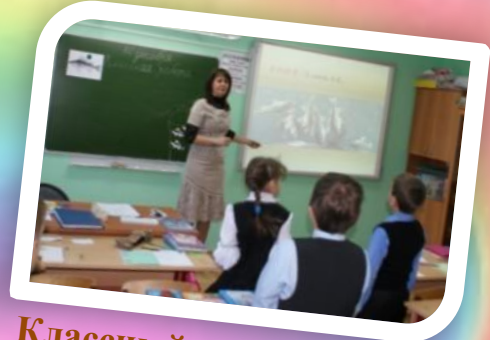
Классный час «Изучай и береги родную природу»