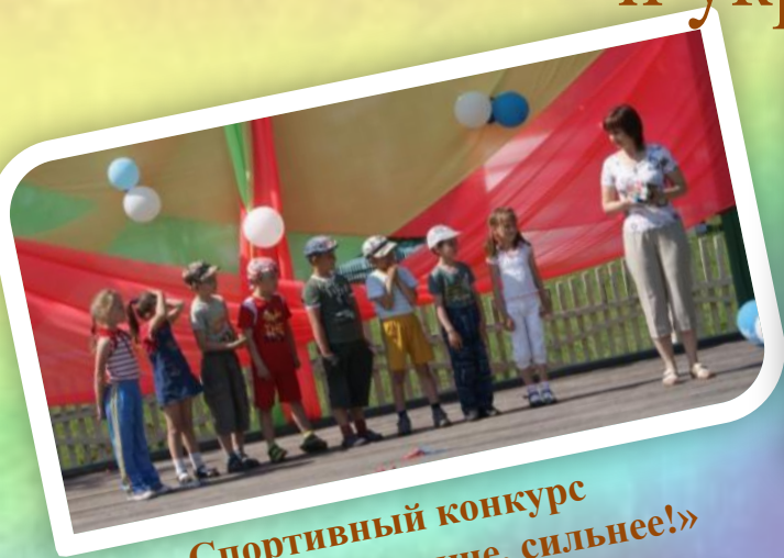
Спортивный конкурс "Быстрее, выше, сильнее!"