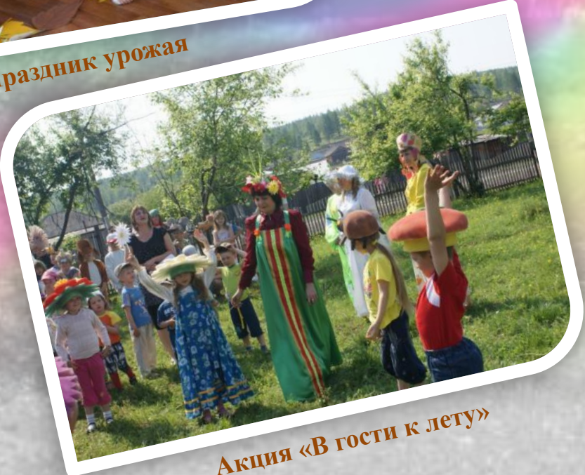
Акция «В гости к лету»