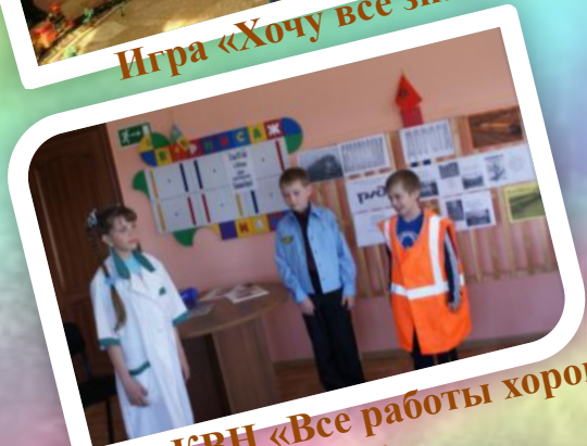
Игра-КВН «Все работы хороши, выбирай на вкус!»