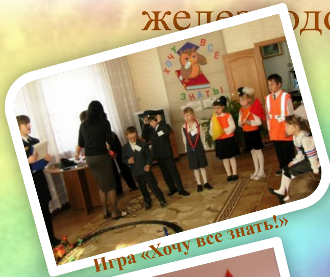
Игра «Хочу все знать!»