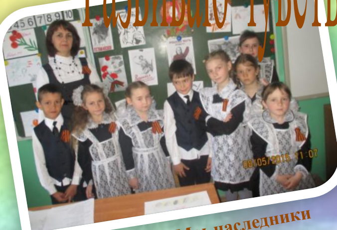
Классный час «Мы-наследники Великой Победы»