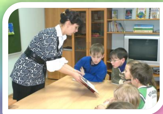
Заседание «Клуба Почемучек»