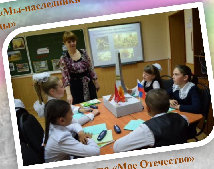
Своя игра «Мое Отечество»