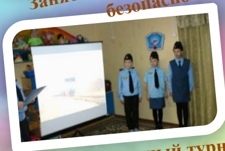
Интеллектуальный турнир «Правила железнодорожные очень серьезные!»