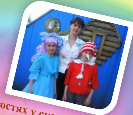
«В гостях у сказки»-театрализованное представление для воспитанников детского сада