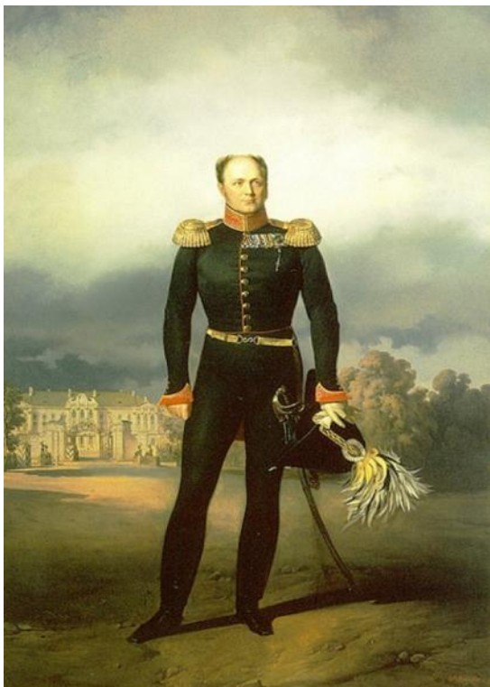
Император Александр I