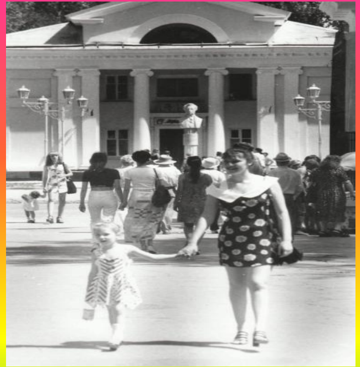
Вид на памятник А.С.Пушкину из парка 1999г.