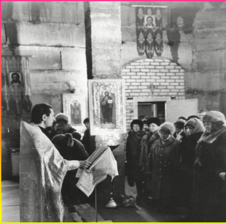
Праздничная литургия 19 января 1999г.