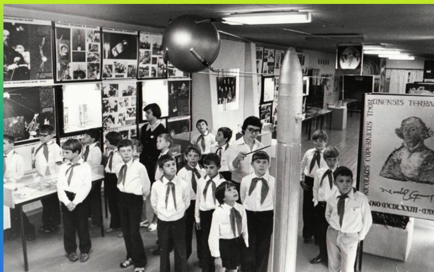
В музее космонавтики школа №24 1978г.