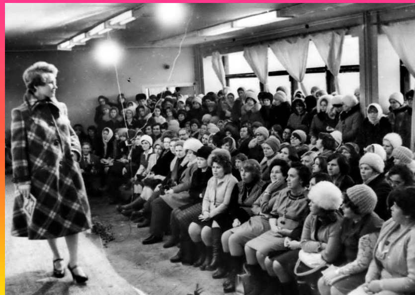
Конкурс «Мода 79»