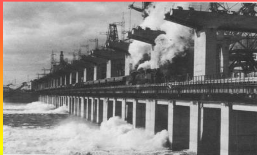
Вид на ГЭС со стороны нижнего бьефа. 1959г.