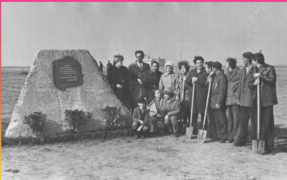
Камень с плитой о закладке парка в честь 60 - летия Октября 1977г.