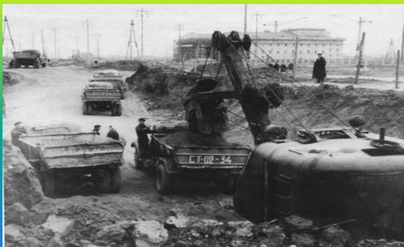
Строительство жилых домов на проспекте Ленина. 1954г.