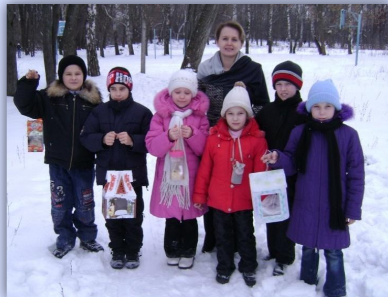
Акция «Кормушка для птиц»