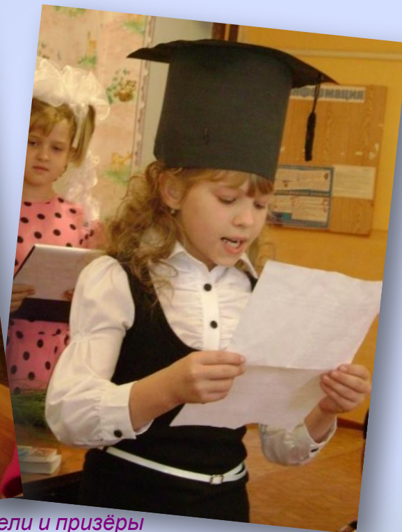
Победители и призёры районных творческих конкурсов