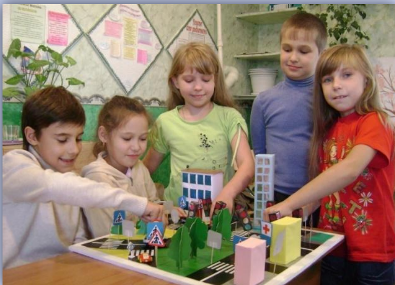
Создание макета на конкурс