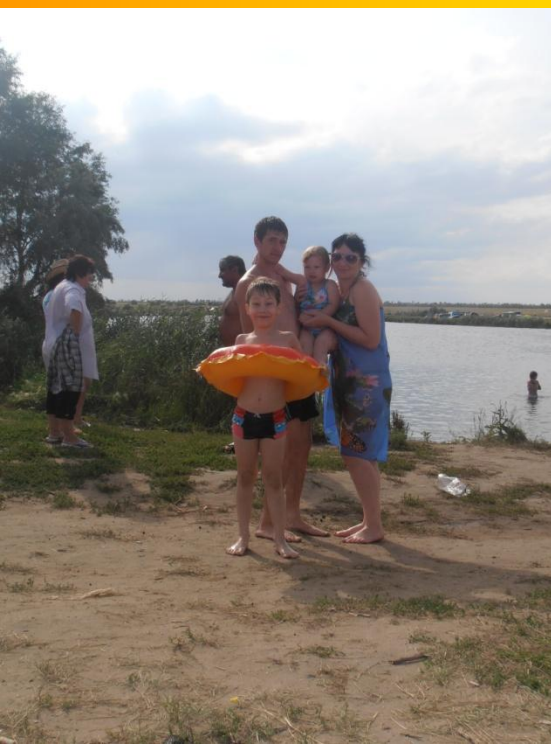
Наша семья на отдыхе