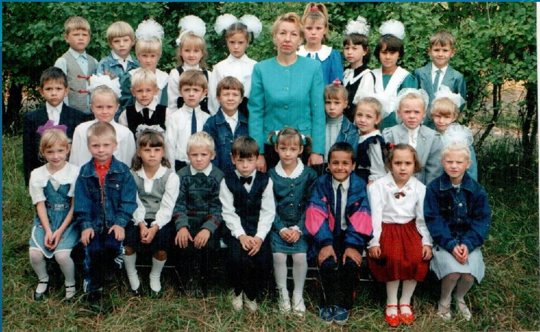
1 «А» класс 1996 год