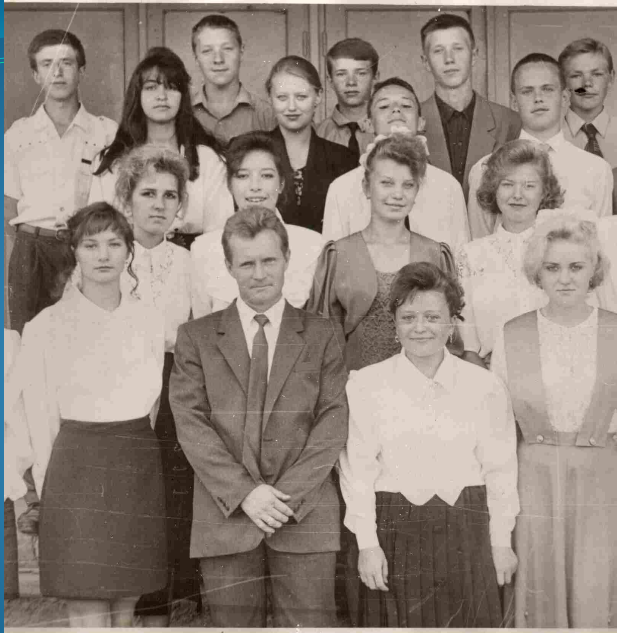
Молодой учитель истории