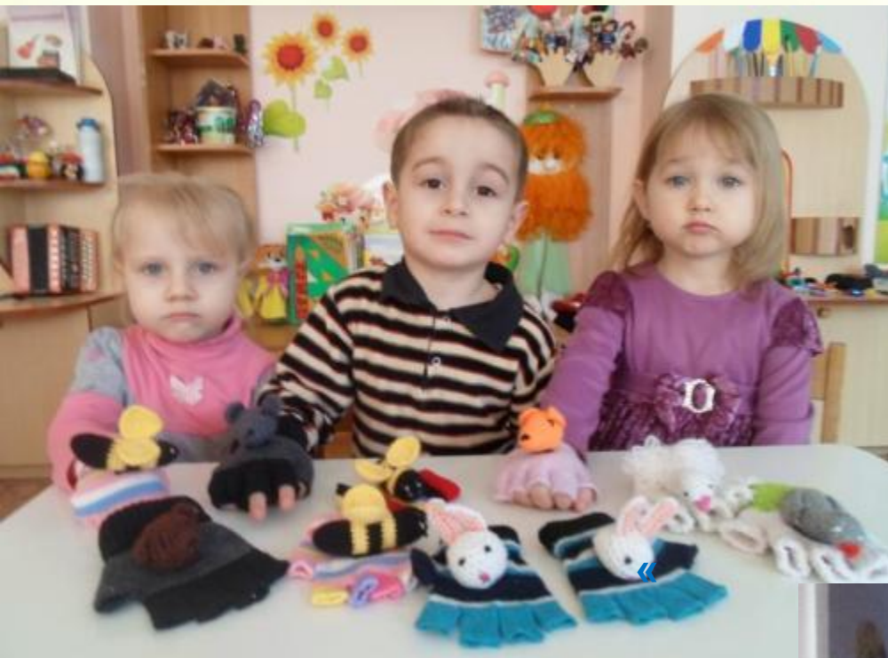
«Театр на перчатке»