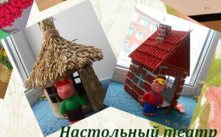
Настольный театр "Три поросенка"