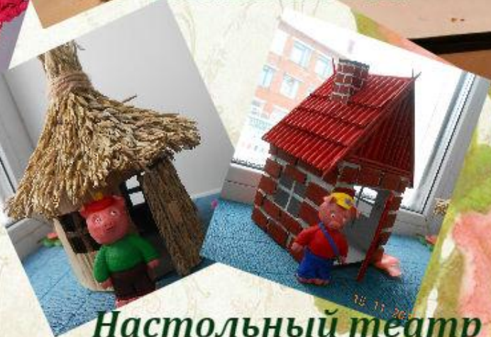
Настольный театр "Три поросенка"