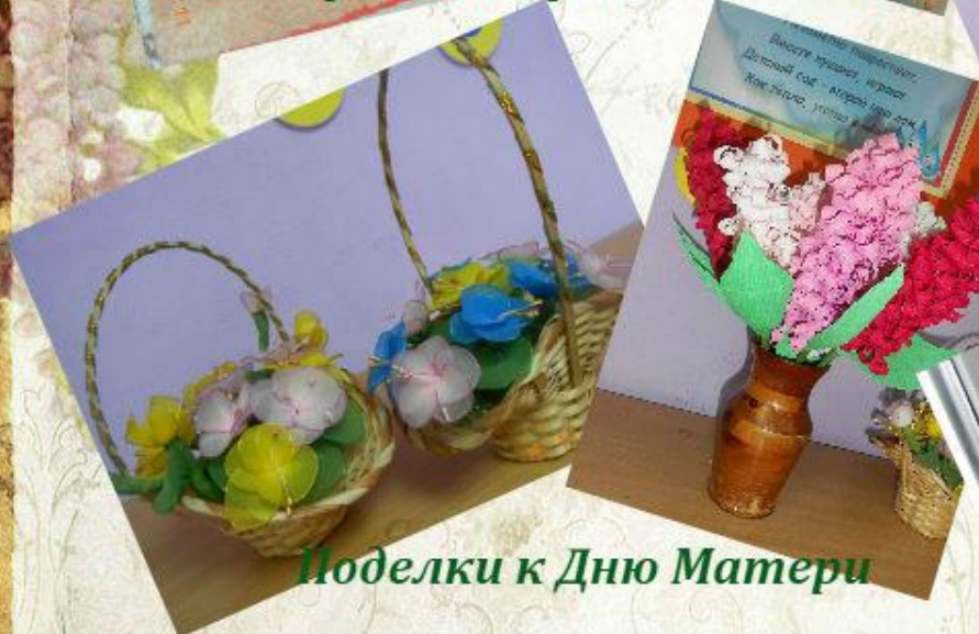
Поделки к Дню Матери