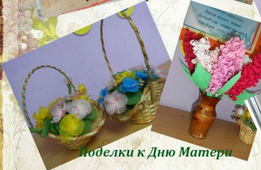
Поделки к Дню Матери