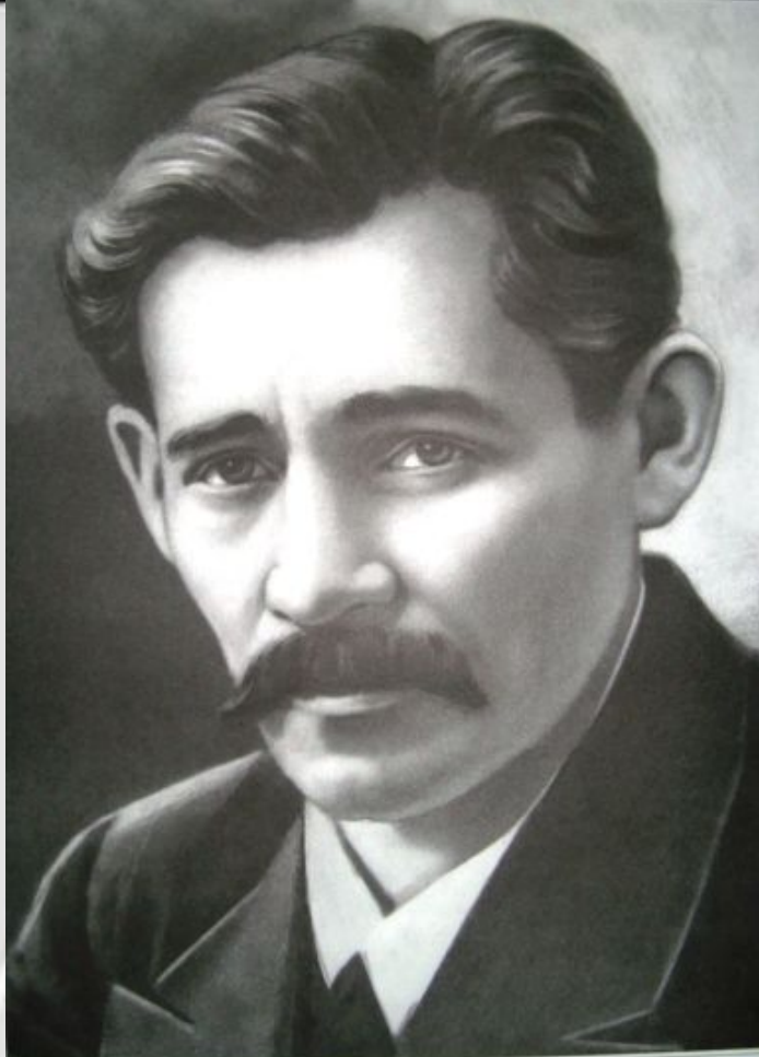
МӘЖИТ ГАФУРИ (1880–1934)