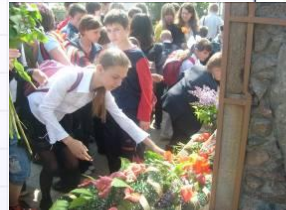
Участие в митингах и возложении цветов