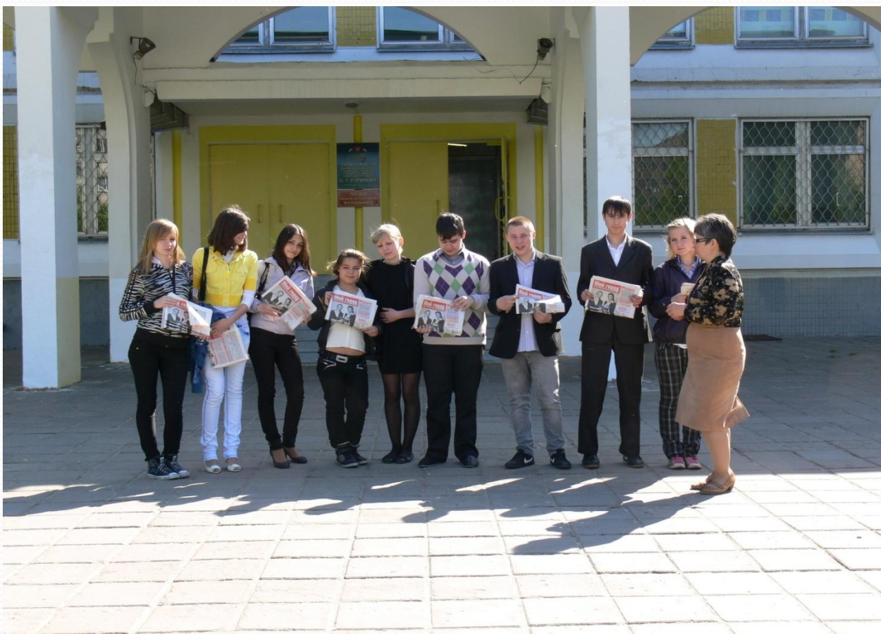
Инструктаж участников проекта