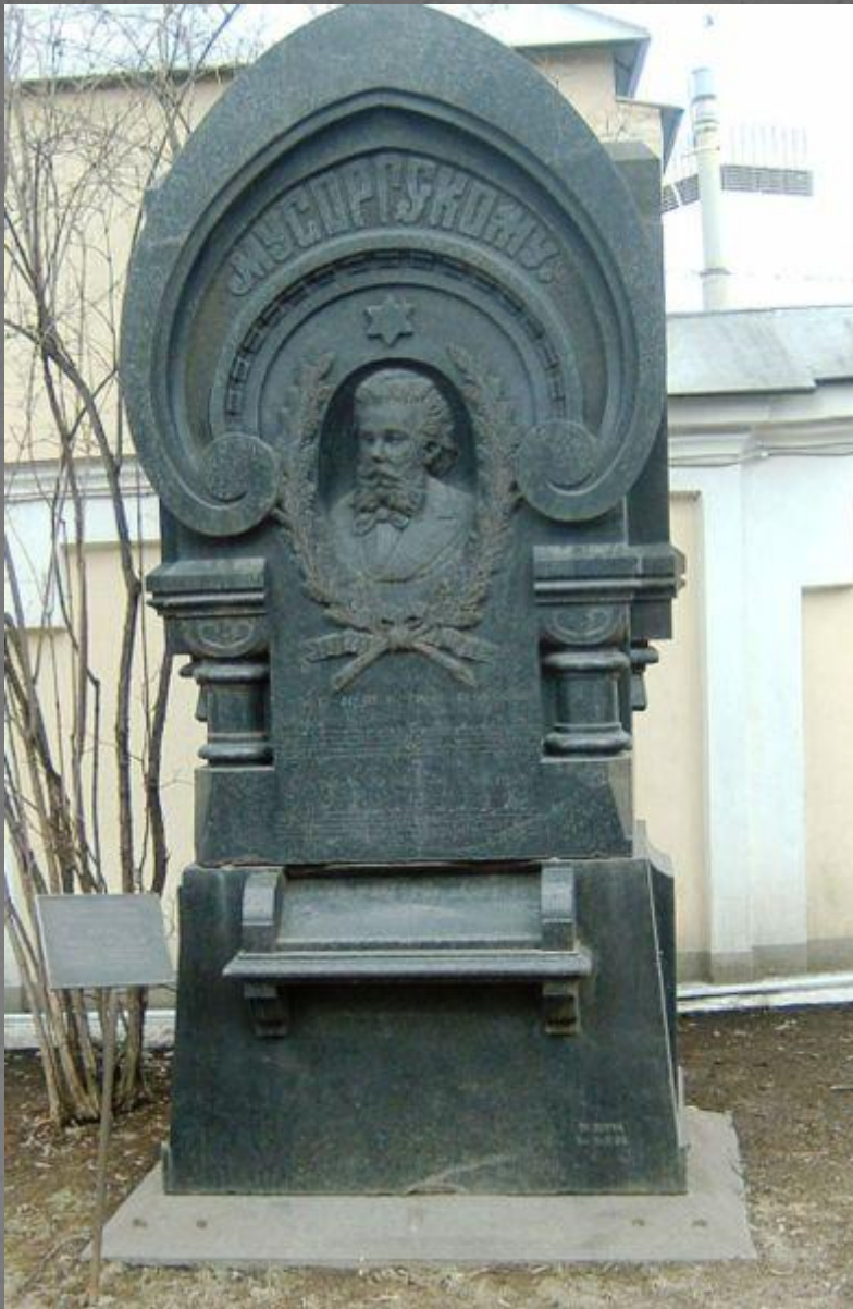
Памятник на могиле М. П. Мусоргского (Санкт- Петербург, Александро- Невская лавра)