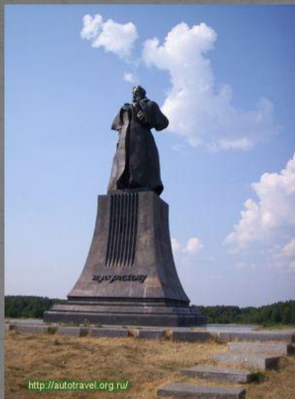
Памятник М.П. Мусоргскому на Лысой Горе