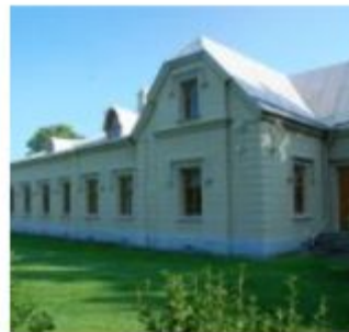
Дворцовая телеграфная станция