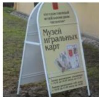
Музей Игральных Карт