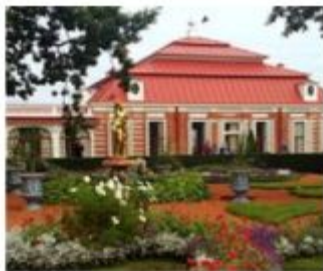
Исторический музей-дворец Монплеzier