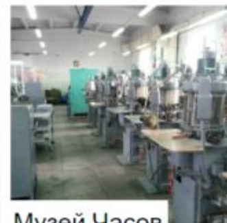
Музей Часов при ПЧЗ Ракета