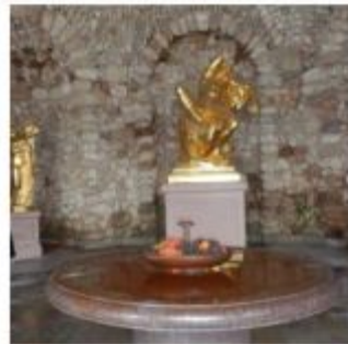
Музей фонтанного дела