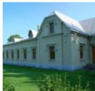
Дворцовая телеграфная станция