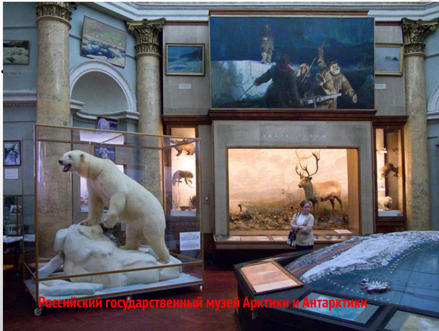
Российский государственный музей Арктики и Антарктики