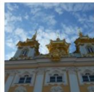
Музей Семьи Бенуа,