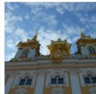
Музей Семьи Бенуа,