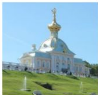
Музей "Особая кладовая"