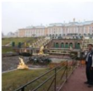
Музей Банный корпус