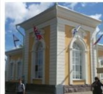
Музей "Императорские яхты"