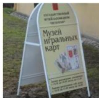
Музей Игральных Карт