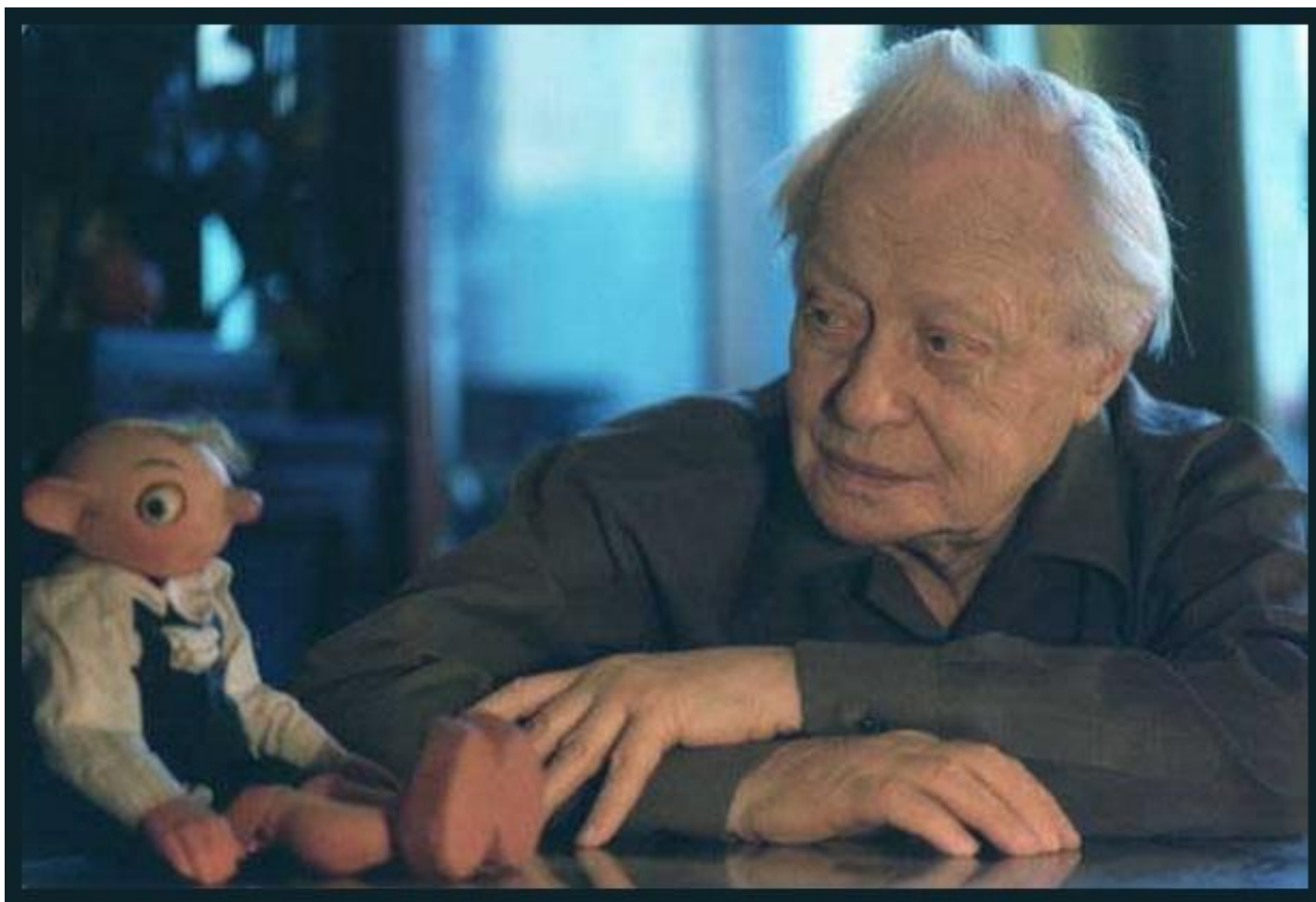
С. В. Образцов с куклой Гурвинек