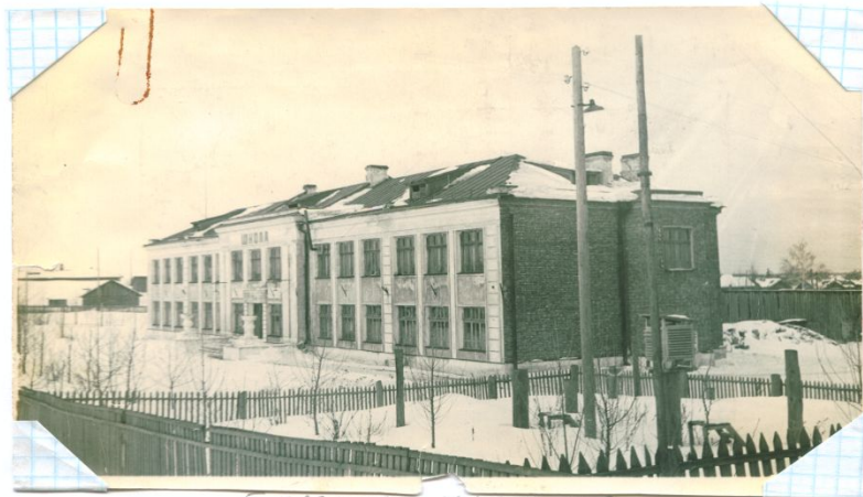
5 здание школы № 2