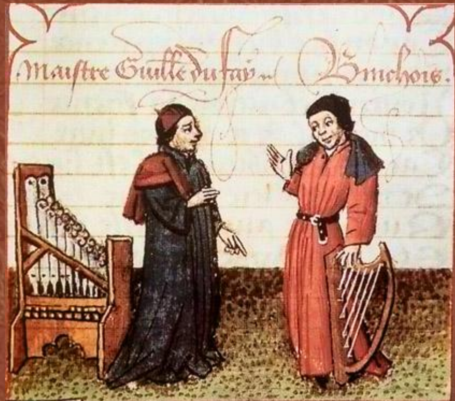
Дюфаї (ліворуч) і Жиль Беншуа