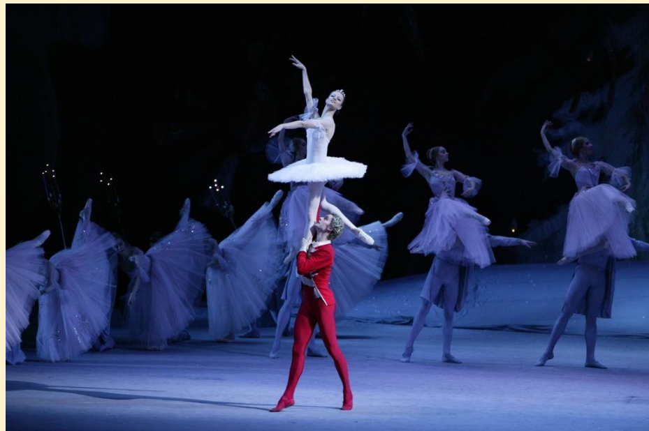
П.И. Чайковский балет «Щелкунчик»

Даже опера и балет обрели на экране как бы второе рождение. Для телеоперы, телебалета многие композиторы специально пишут музыку.