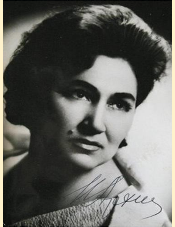
И. К. Архипова