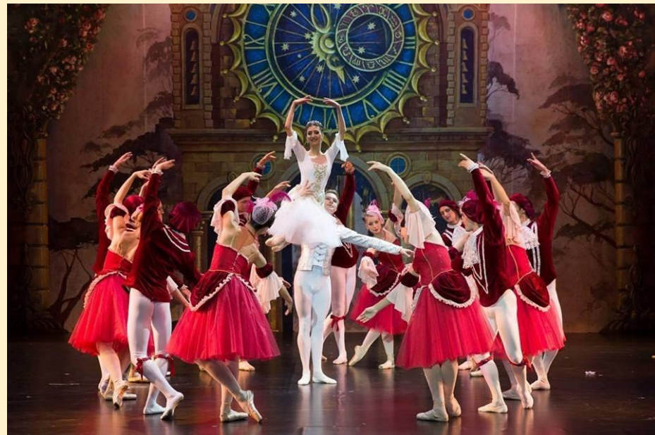
С.С. Прокофьев балет «Золушка»