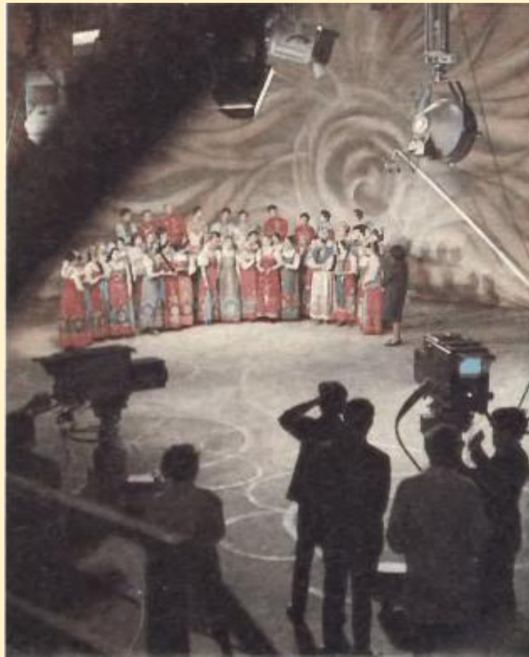
Запись выступления хора на телевидении.