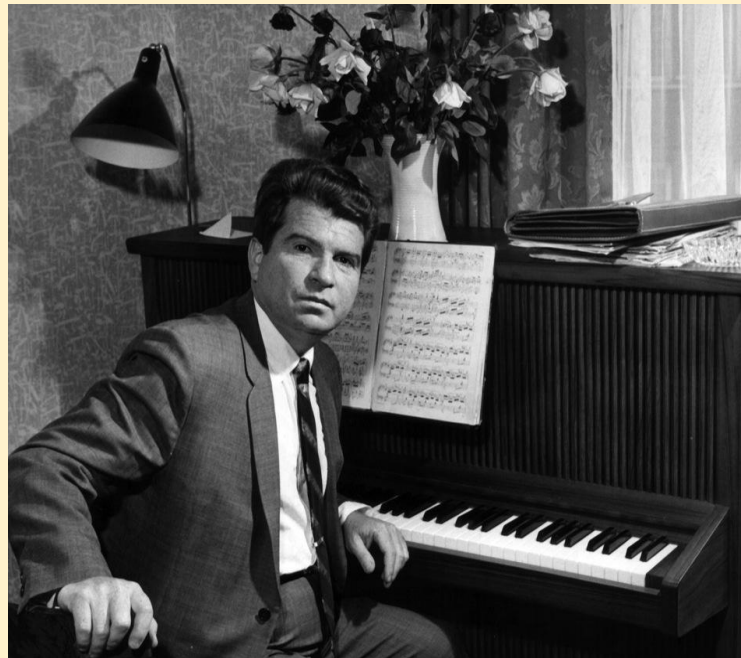
Э. Г. Гилельс