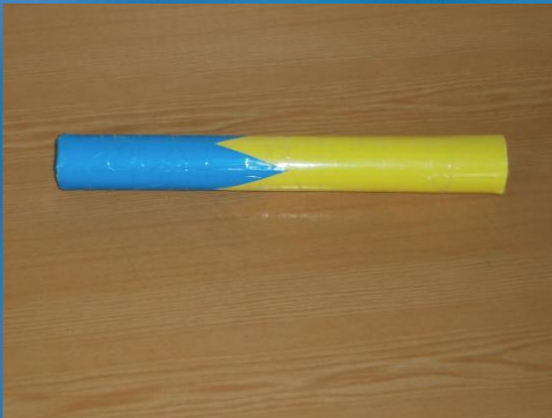
Флейта дождя (Шум дождя) из трубки, зубочисток и наполнителя(крупы)