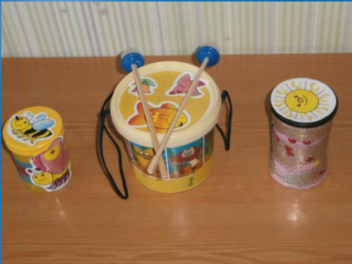
Барабаны из железных (пластмассовых) банок и деревянные палочки с наконечниками из контейнеров для бахил