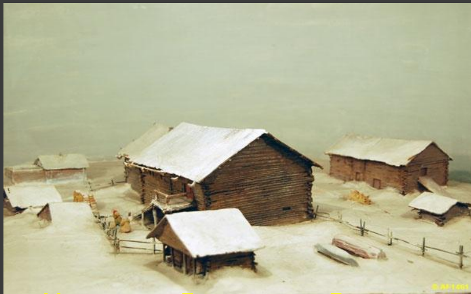
Макет дома Ломоносова. Деревня Мишанинская. Музей Ломоносова.