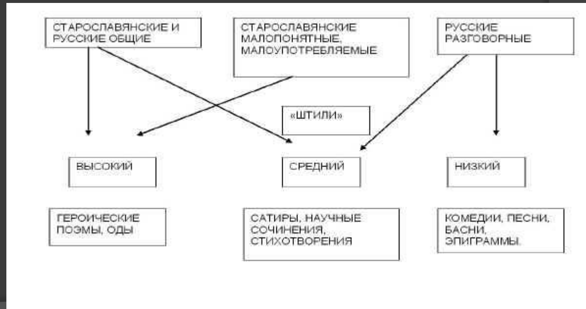
Теория Ломоносова о «трех штилях»