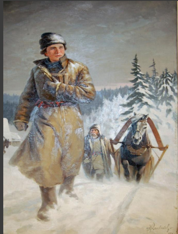
Н.И. Кисляков «Юноша Ломоносов на пути в Москву»