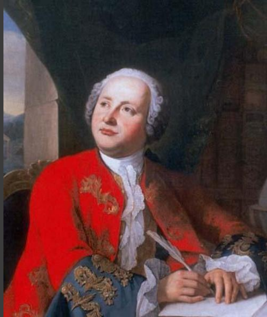
Михаил Васильевич Ломоносов (8 ноября 1711 — 4 апреля 1765)