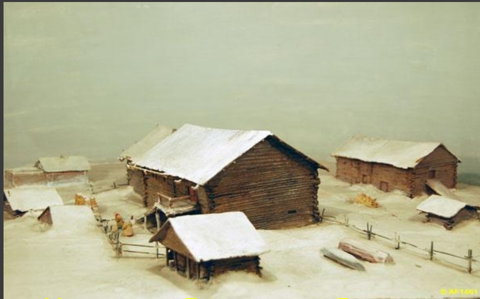
Макет дома Ломоносова. Деревня Мишанинская. Музей Ломоносова.