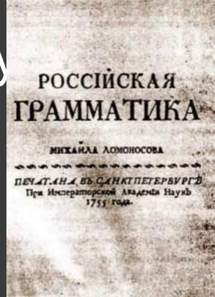
"Российская грамматика" М.В. Ломоносова