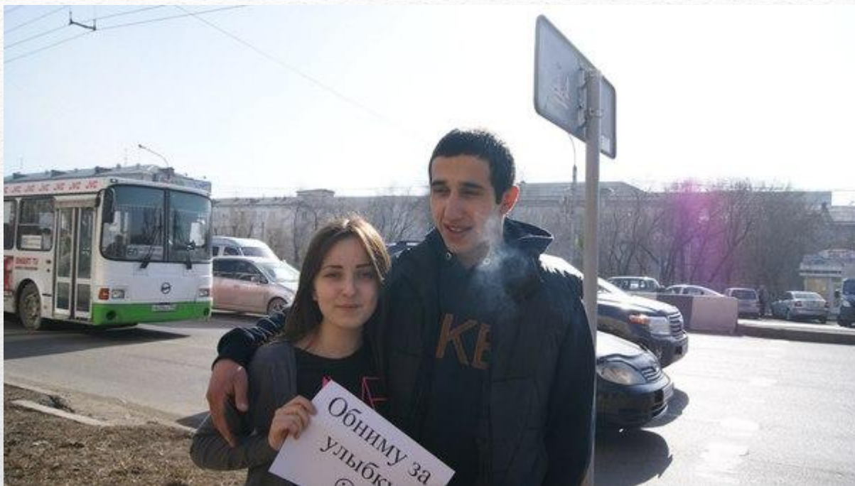
Акция «Обниму за улыбку в рамках краевой акции «Энергия успеха» ((мероприятие КИМ «Лидер»))