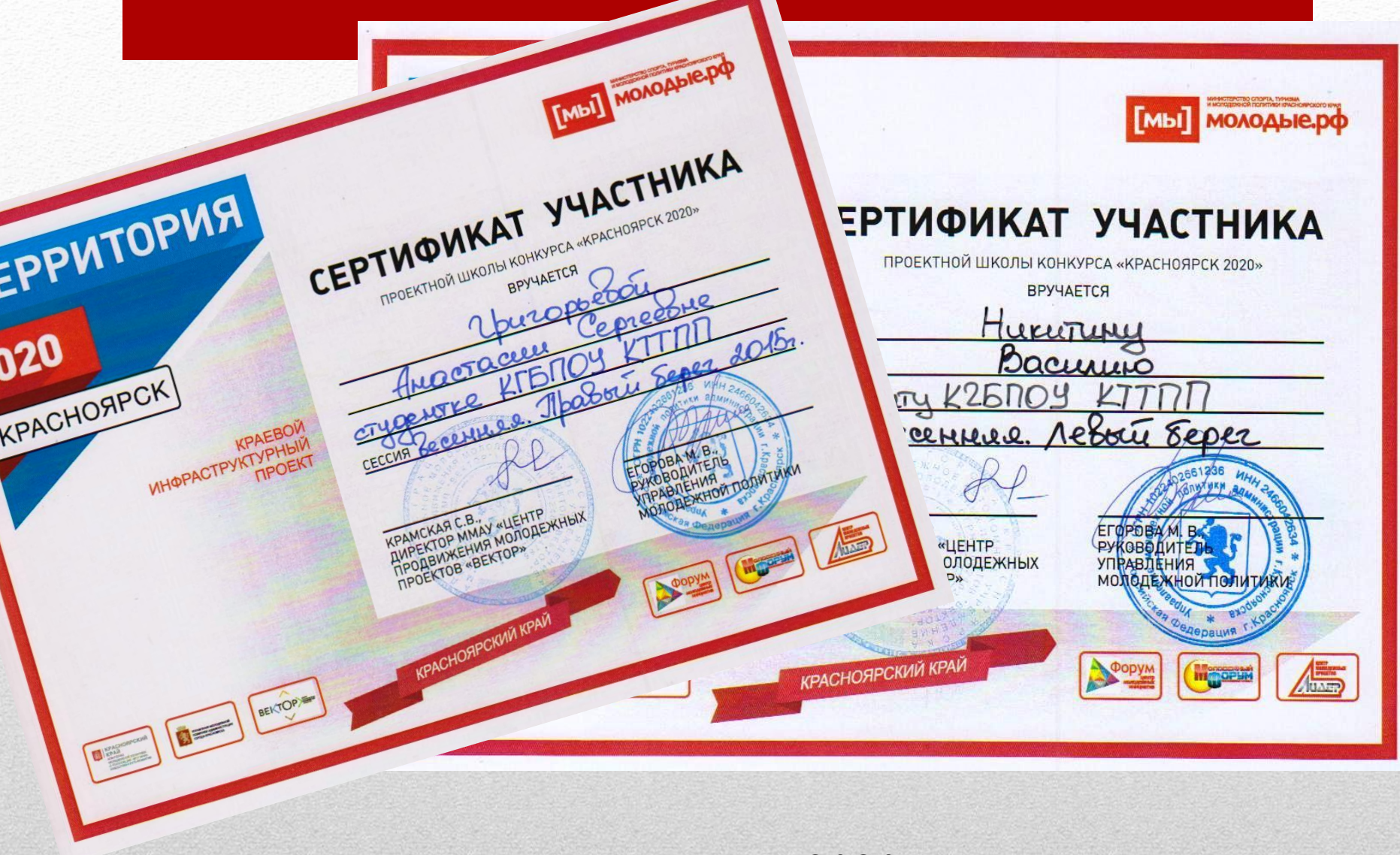
Грантовый конкурс «Территория 2020». Наш проект получил административную поддержку