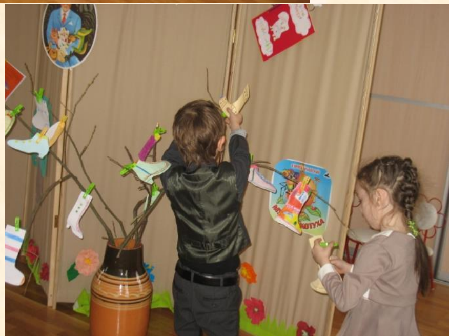
Конкурс – эстафета «Чудо – дерево»