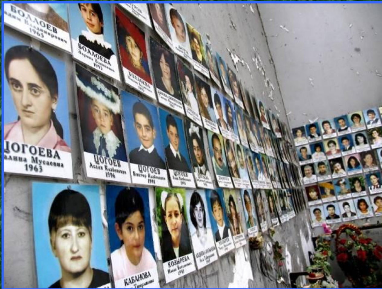
«Галерея скорби». Заложники и жертвы теракта, погибшие в г. Беслане

Заложник — человек, захваченный с целью заставить кого-либо (родственников заложника, представителей власти и т. п.) совершить определённые действия ради освобождения заложника, недопущения его убийства или нанесения серьёзного вреда его здоровью.