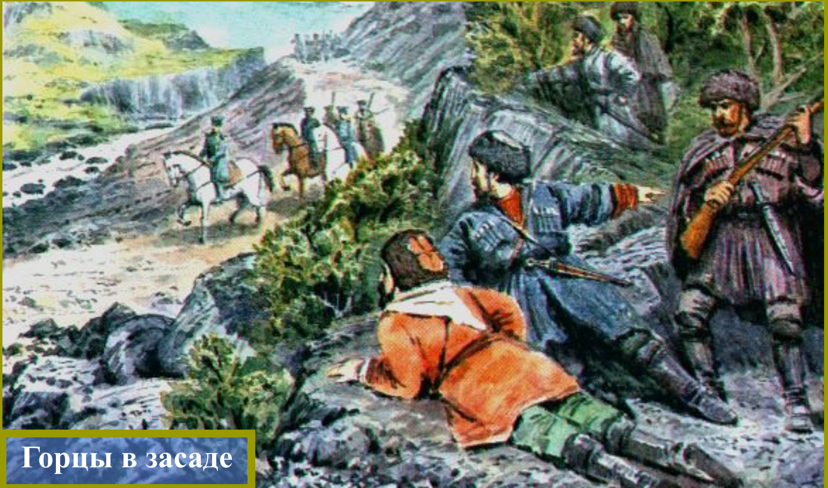
Горцы в засаде

В начале XIX в. на Кавказе проживало более 50 народов относившихся к различным языковым семьям. Говоря на разных языках и имея разное вероисповедание они нередко вели между собой кровопролитные войны, совершали набеги на соседей, грабя и разрушая их поселения, уводя в плен мирных жителей для дальнейшей продажи османским купцам в качестве рабов.