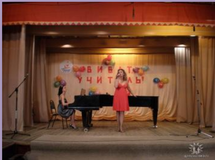
Участник и лауреат конкурса «Виват, учитель!»