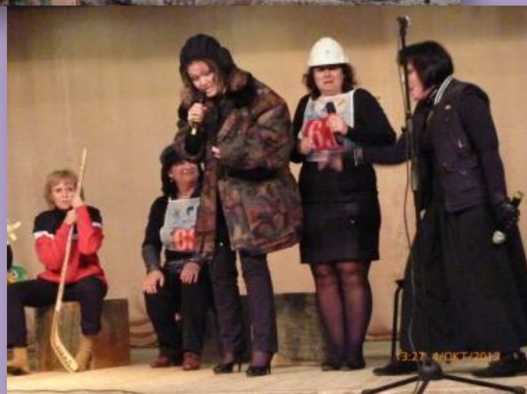
Бессменный член школьной Лиги КВН (педагоги)