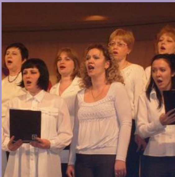
Участник хорового коллектива педагогов школы