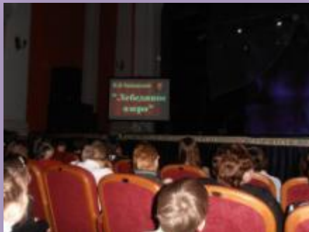
Встреча с прекрасным

Цели: Гармоничное духовное развитие личности школьника Привитие основополагающих принципов нравственности на основе патриотических, культурно – исторических традиций России.