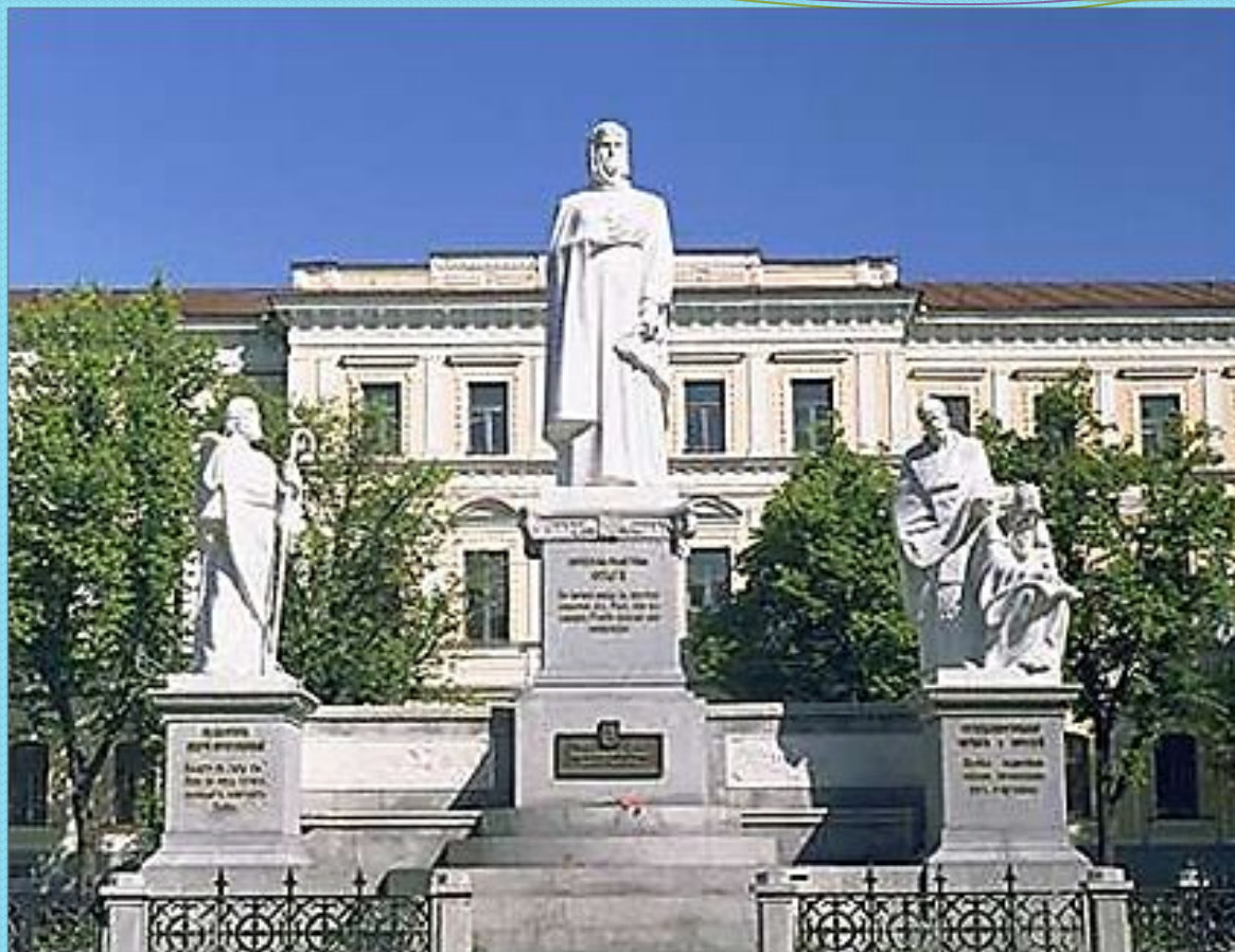
Памятник княгине Ольге, Св. Апостолу Андрею Первозванному и равноапостольным Кириллу и Мефодию в Киеве