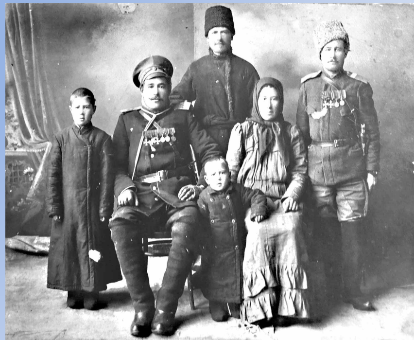
Казаци-Нагайбаки в начале XX века