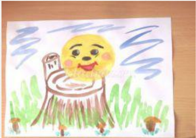
Рисунок и музыка