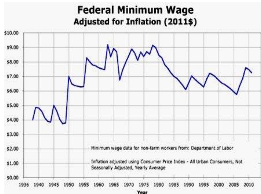
График изменения минимальной заработной платы в США