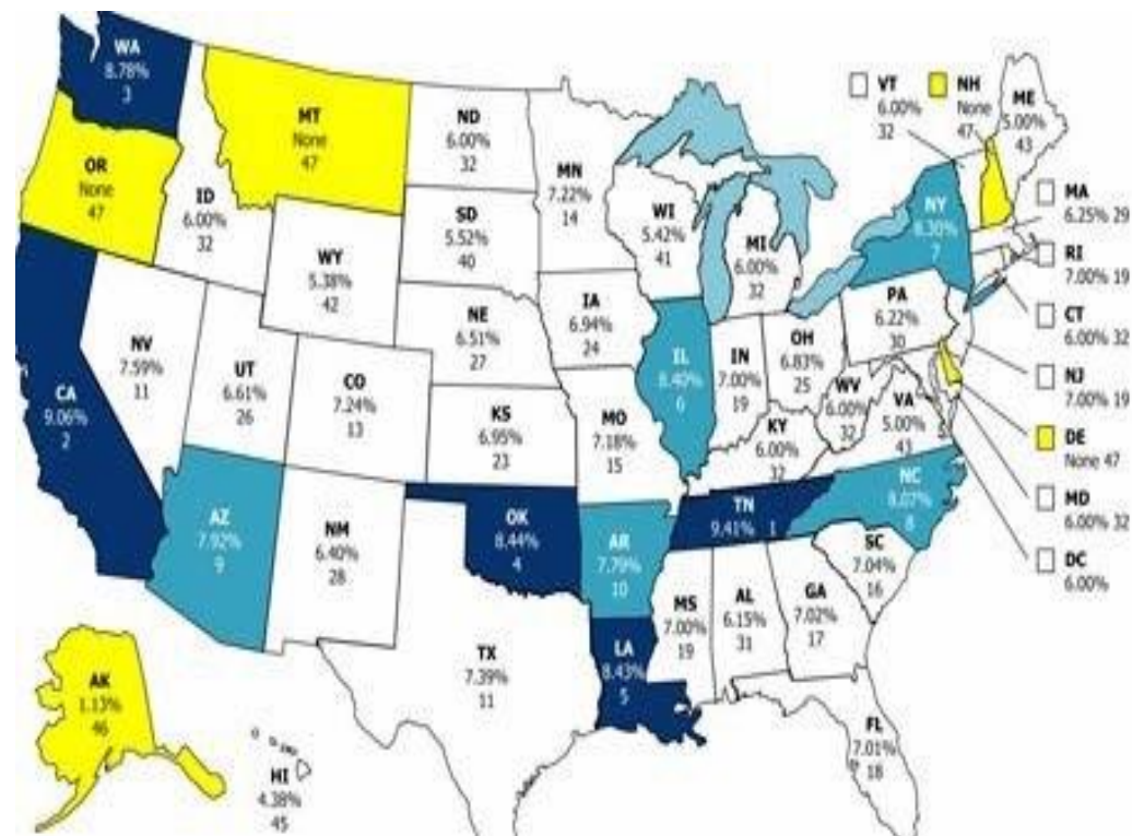
Карта налогов по штатам Америки

Помимо федерального подоходного налога, также необходимо платить и по месту проживания. Размер выплат варьируется в зависимости от штата и составляет 3—10 процентов дохода.