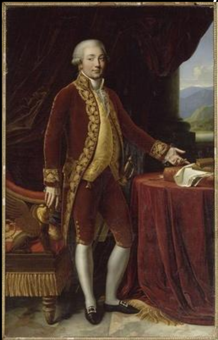
Карло Мария Бонапарте (1746-1785)- отец Наполеона Бонапарта.