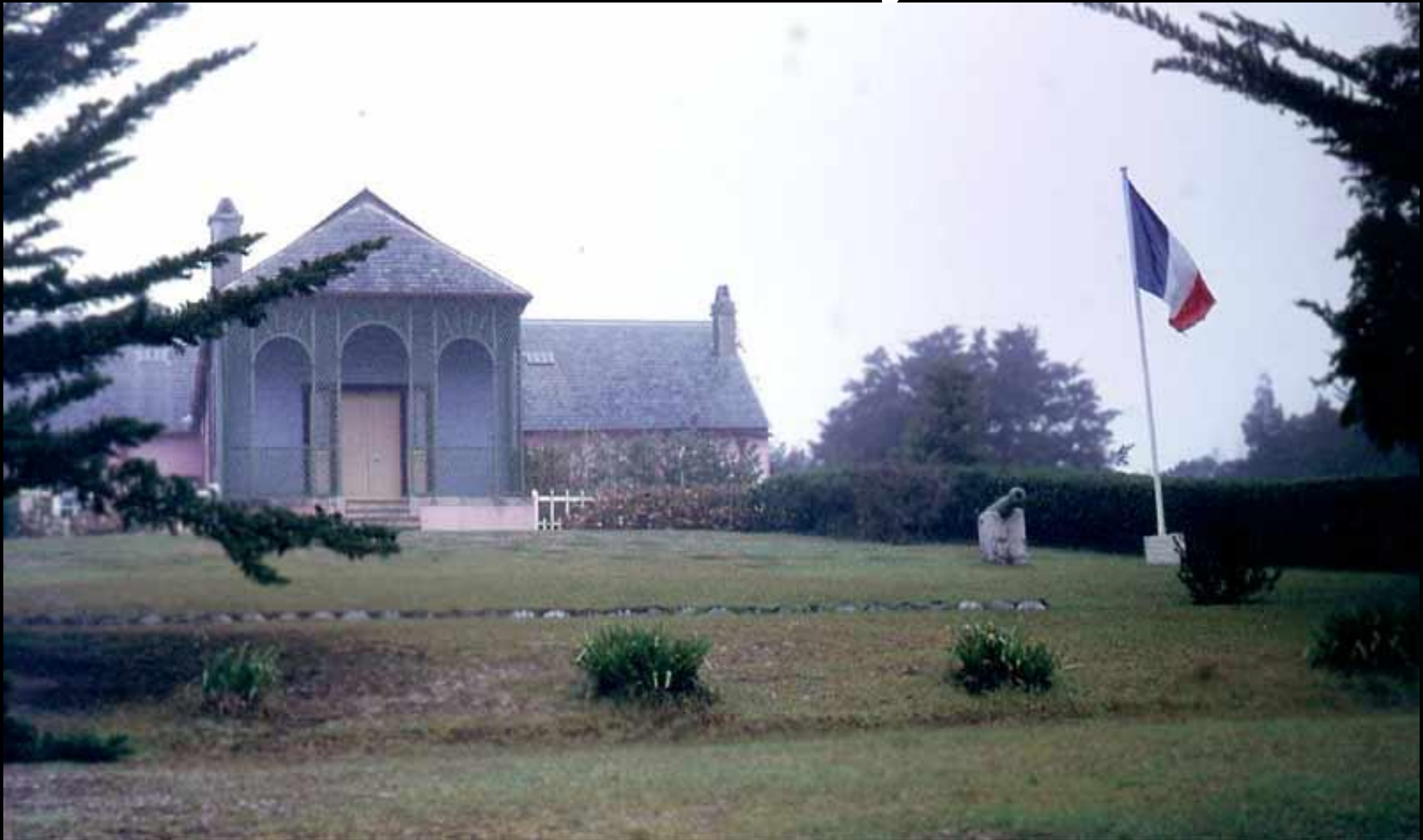
Остров Святой Елены

20 апреля 1814 года Наполеон покинул Фонтенбло и отправился в ссылку.