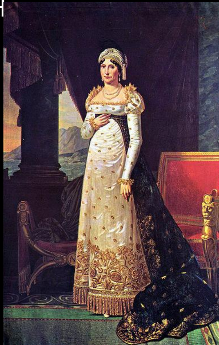
Мария Летиция Рамолино (24.08.1750 — 2.02.1836) — мать Наполеона Бонапарта.