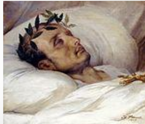
Наполеон на смертном