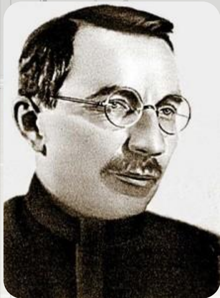
Макаренко А.С. (1888-1939)

Педагоги, чьи имена известны всему миру, указывали на огромную роль воспитания в раннем детстве.