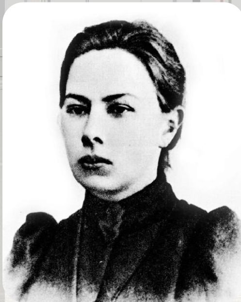
Крупская Н.К. (1869-1939)