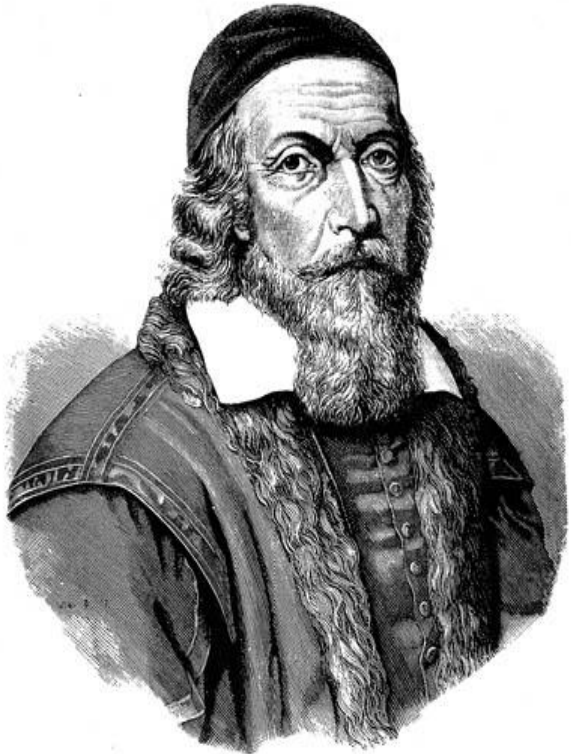
Ян Амос Каменский (1592- 1670)