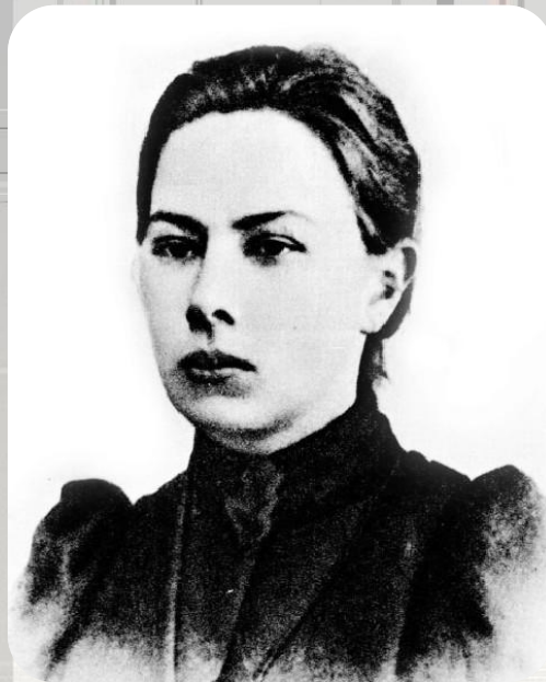
Крупская Н.К. (1869-1939)