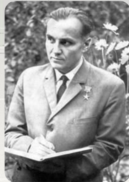
Сухомлинский В.А. (1918-1970)