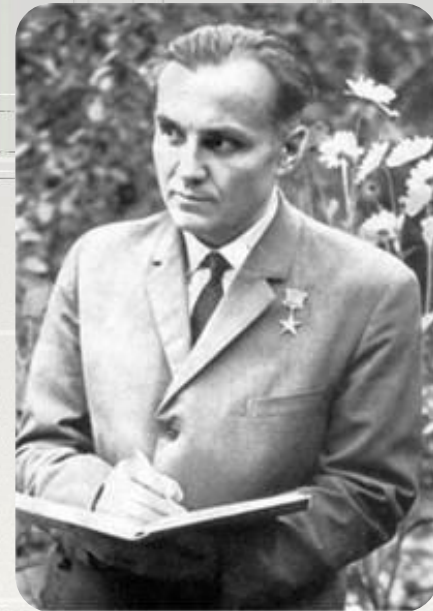
Сухомлинский В.А. (1918-1970)