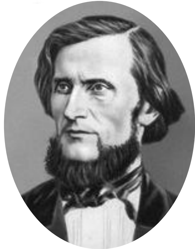
Константин Дмитриевич Ушинский (1824-1871)