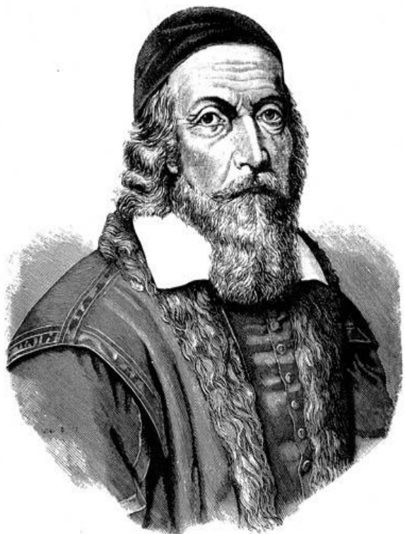
Ян Амос Каменский (1592- 1670)