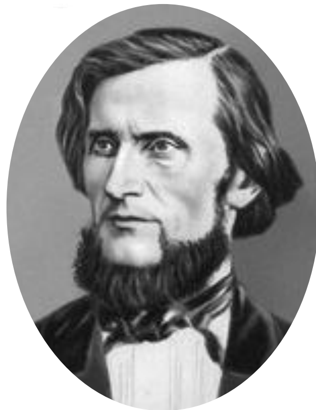
Константин Дмитриевич Ушинский (1824-1871)