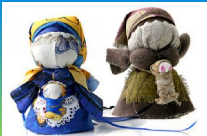
«Мамка с дитём»