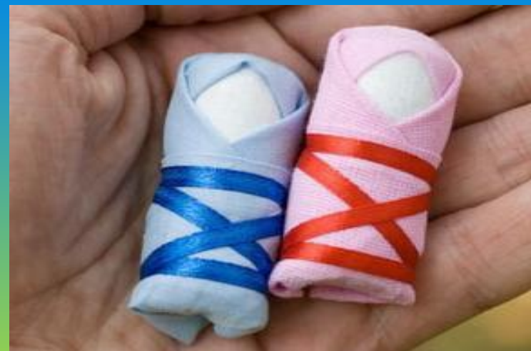
Оберег для новорожденных