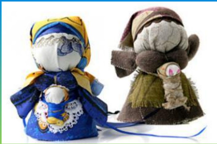
«Мамка с дитём»