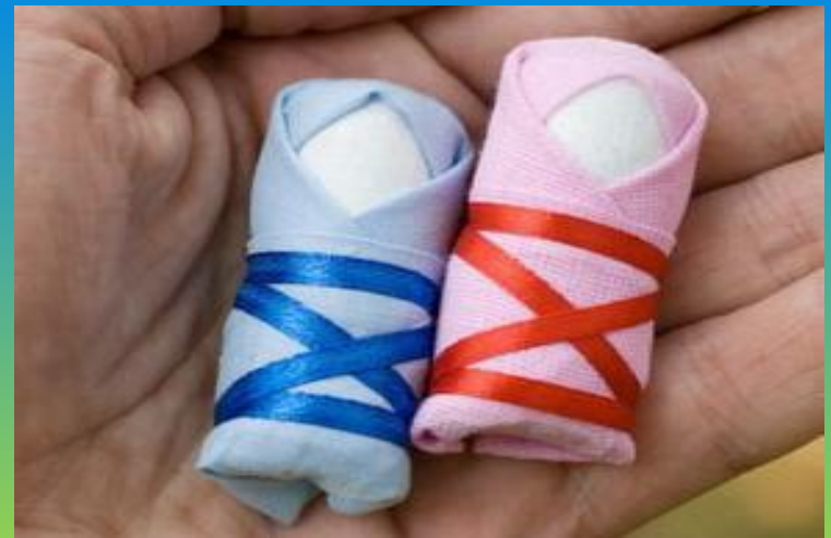
Оберег для новорожденных